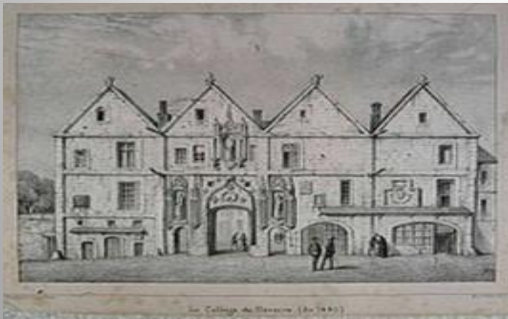
Наваррский колледж XV в.

Колледжи – учебные заведения повышенного типа, впервые появившиеся во Франции в XV веке. Изначально колледжи возникали при факультетах университетов, позже – приобретали автономию. Программа обучения в колледжах соответствовала программе факультетов, под началом которых они возникли. К наиболее общим предметам можно отнести латинскую литературу и латинский язык, родной язык, математика.