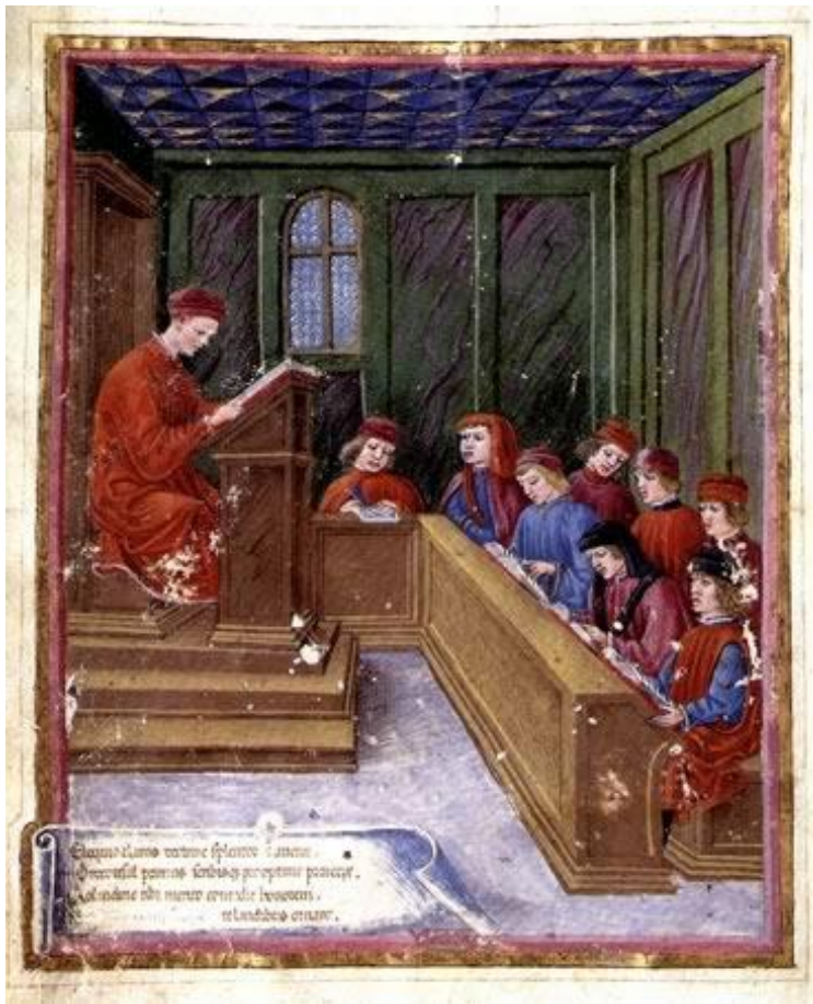
Университет XV в.