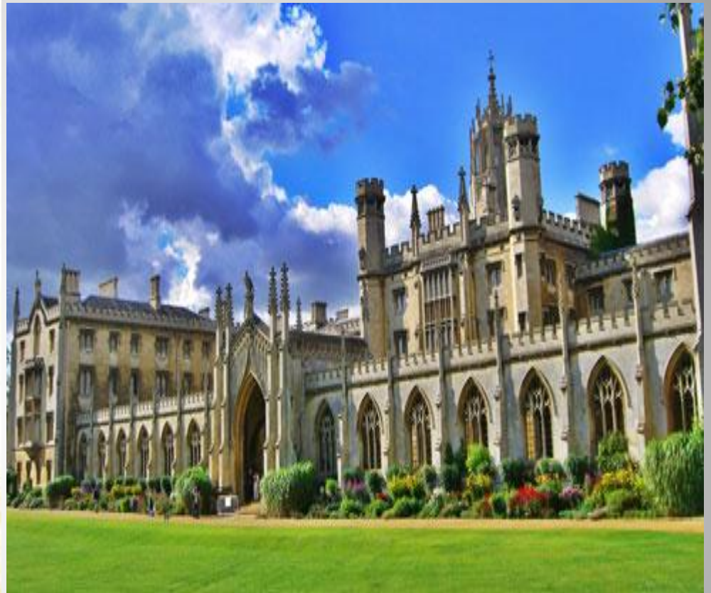
Английский Кембриджский университет.