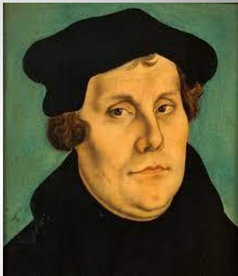
Мартин Лютер (1483-1546 г.)