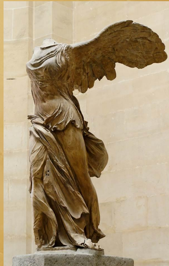
Ника Самофракийская 190 г. до н. э.