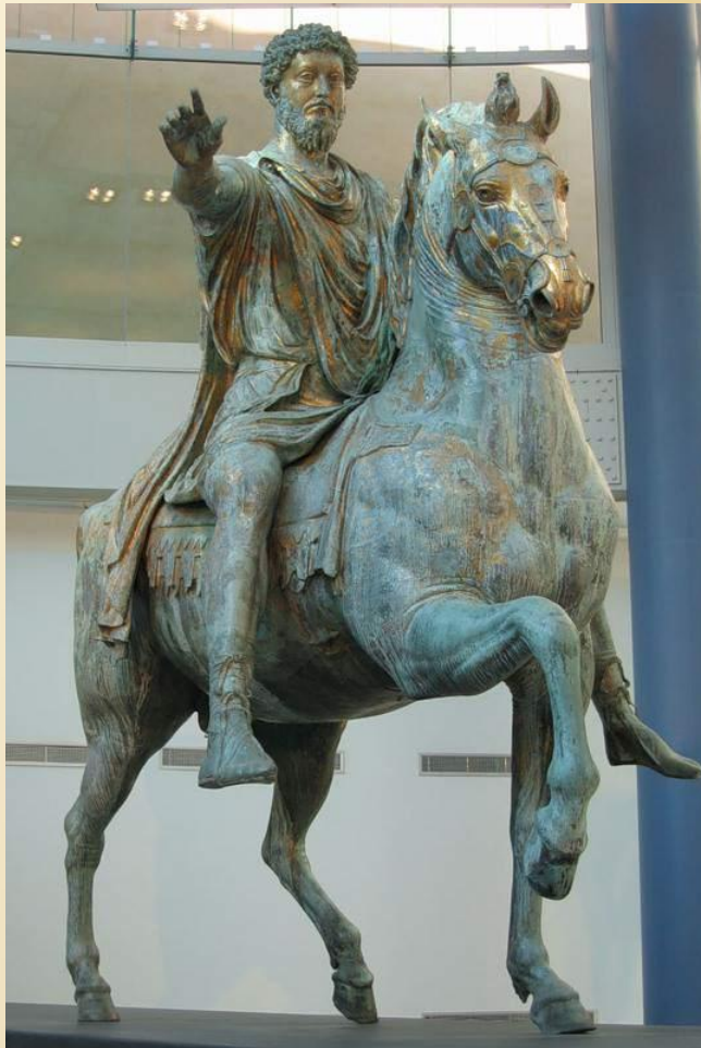
Римский император Марк Аврелий

Мастера Древнего Рима оставили много скульптурных портретов.