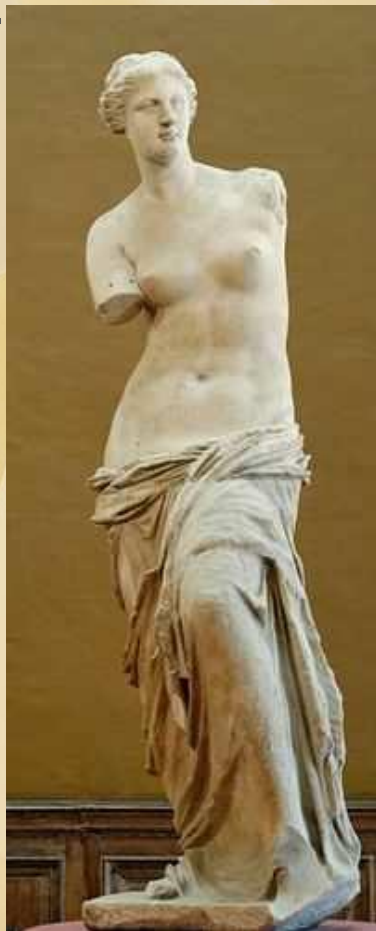
Венера Милосская II в. до н.э.