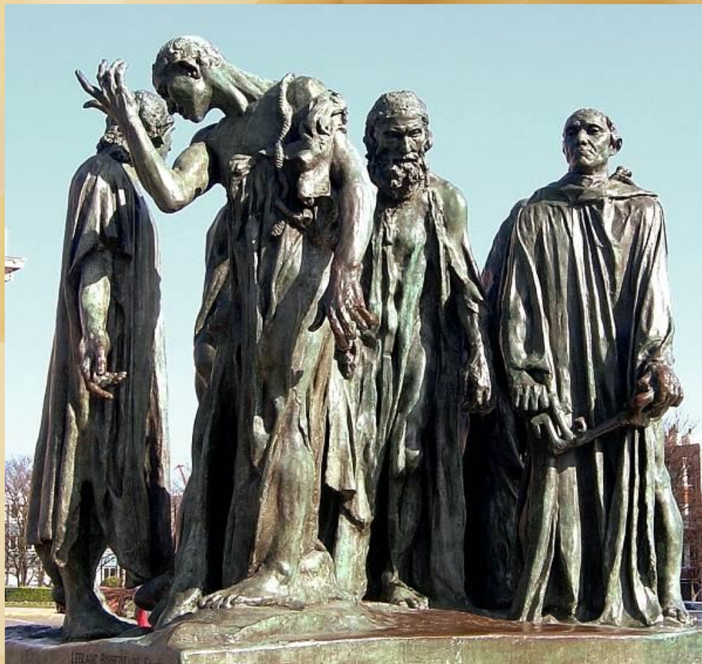
«Граждане Кале» Роден 1888 г.

Во время Столетней войны английский король Эдуард III осадил город, и спустя некоторое время голод вынудил оборонявшихся к сдаче. Король обещал пощадить жителей, только если шесть знатнейших граждан выйдут к нему в рубище и с верёвками на шее, отдавая себя на казнь. Это требование было исполнено. Английская королева Филиппа исполнилась жалостью к этим исхудавшим людям, и во имя своего нерождённого ребёнка вымолила перед супругом для них прощение.