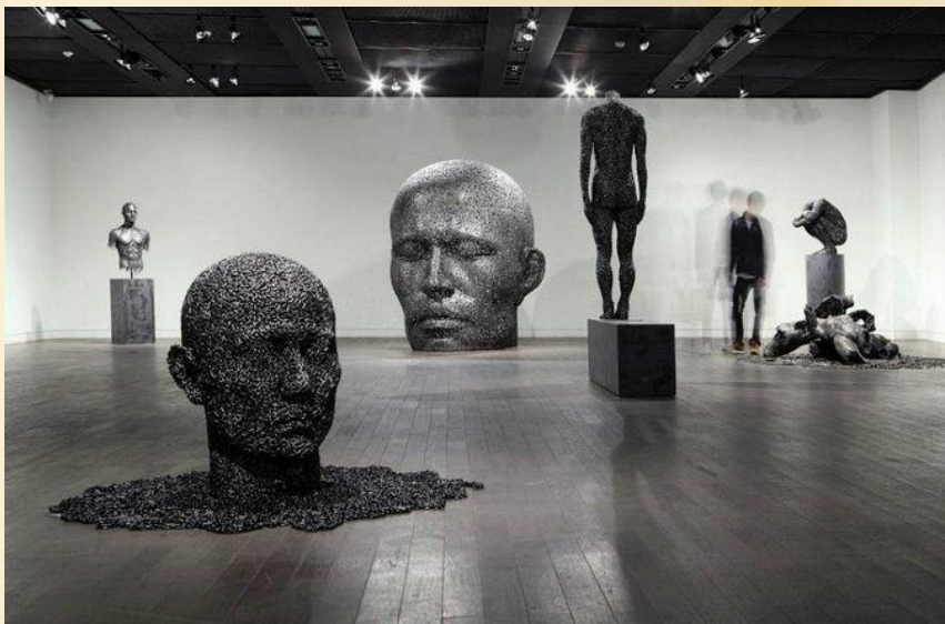
Янг-Део-Сео «Скульптуры из велосипедной цепи»