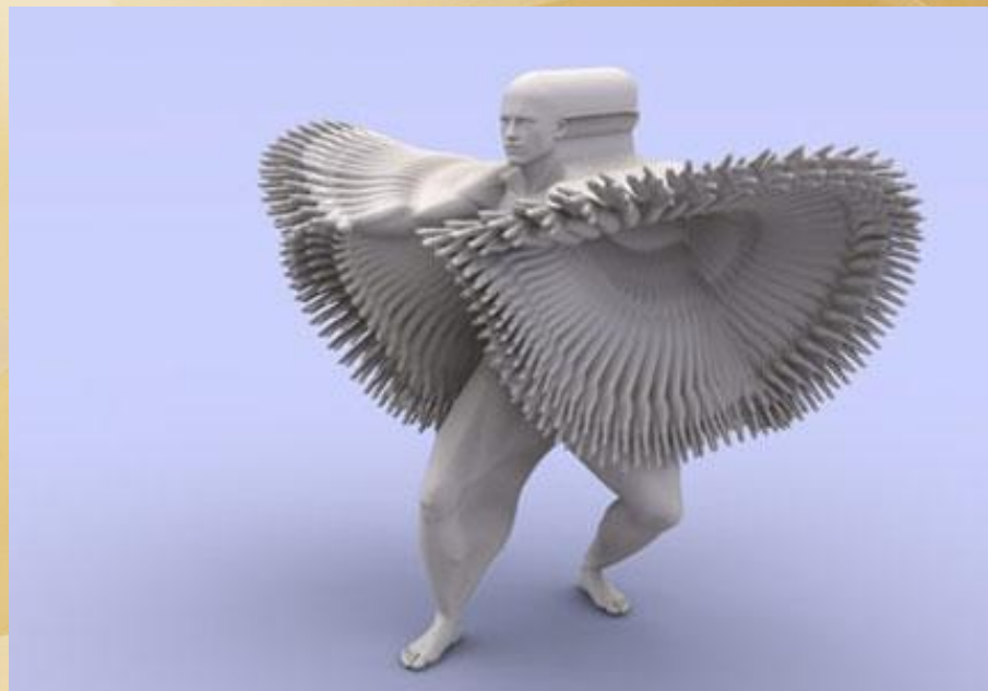
Питер Янсен «Движения человека»