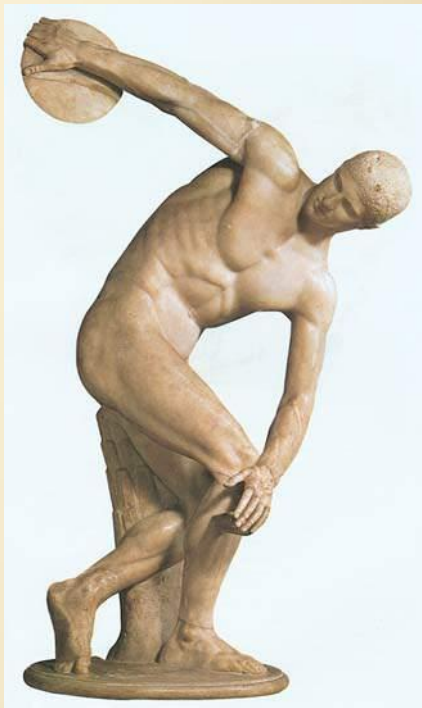
Мирон Дискобол V в. до н.э.

Античное искусство Греции показывает красоту физически совершенного человека.