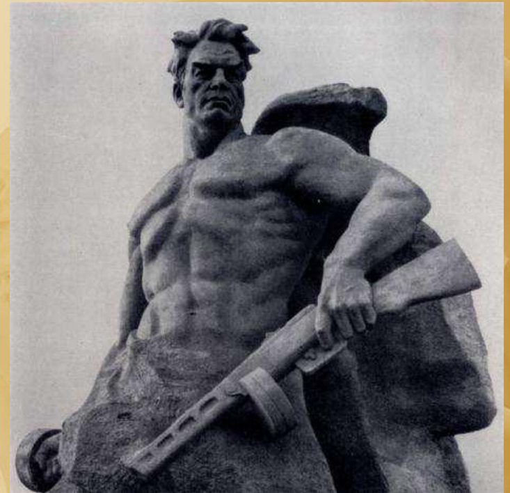
Стоять на смерть Е.В. Вучетич