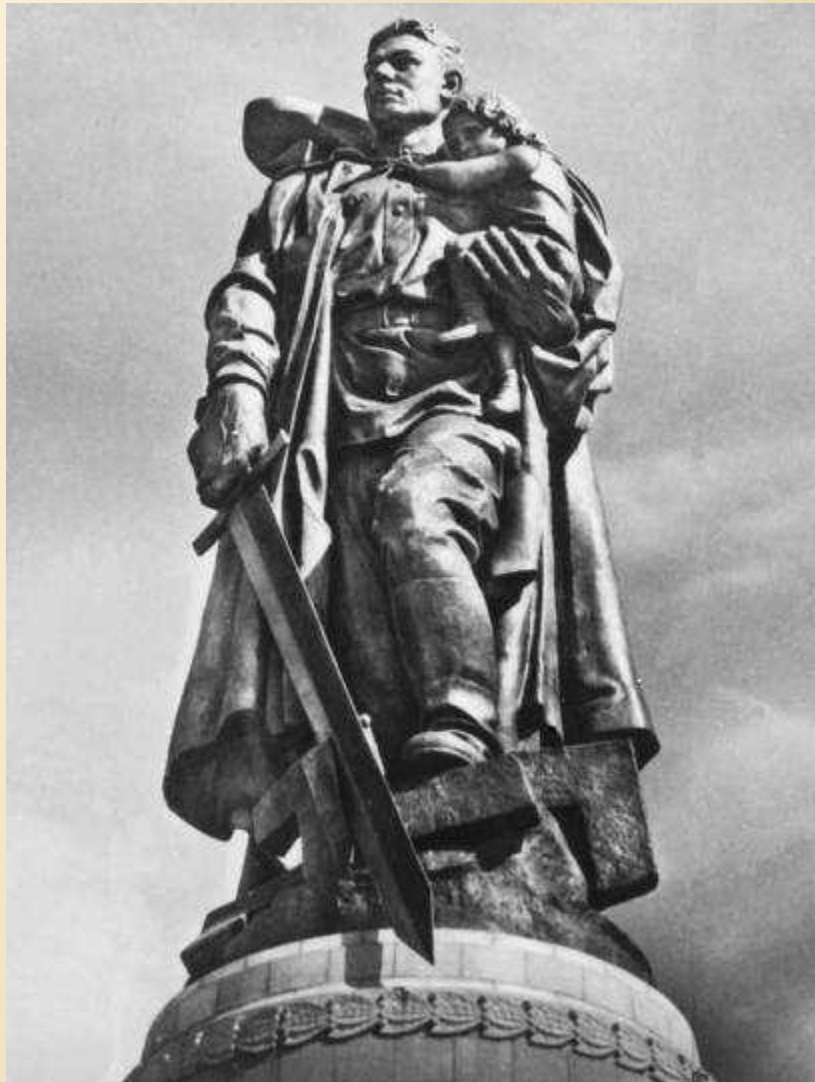
Память советской армии Е.В. Вучетич