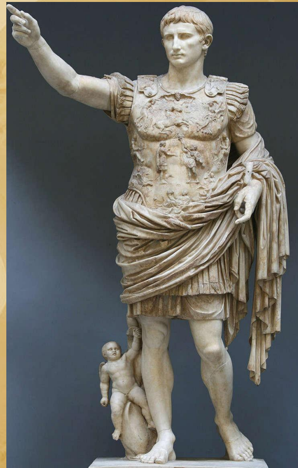
Император Август 27 г. до н.э.