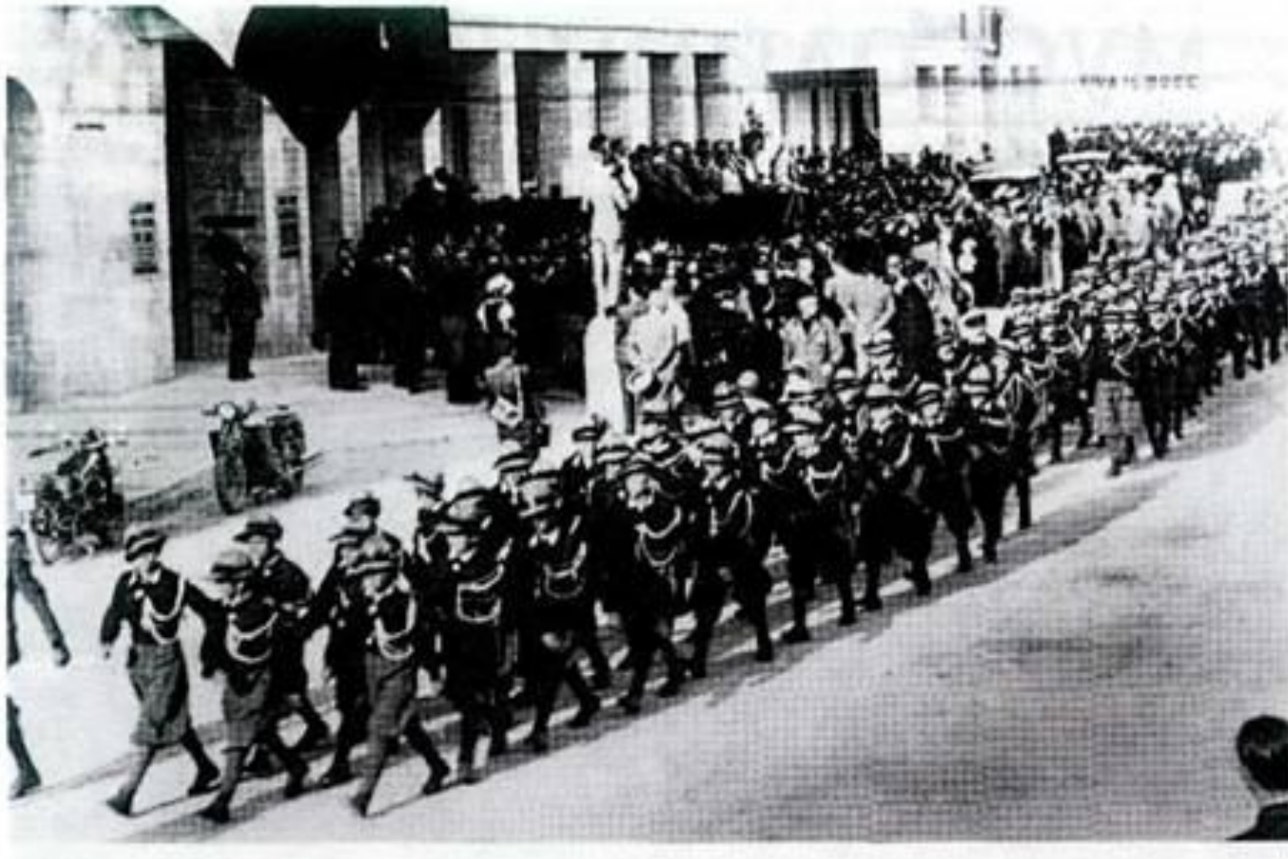
Парад фашистской молодежной организации.