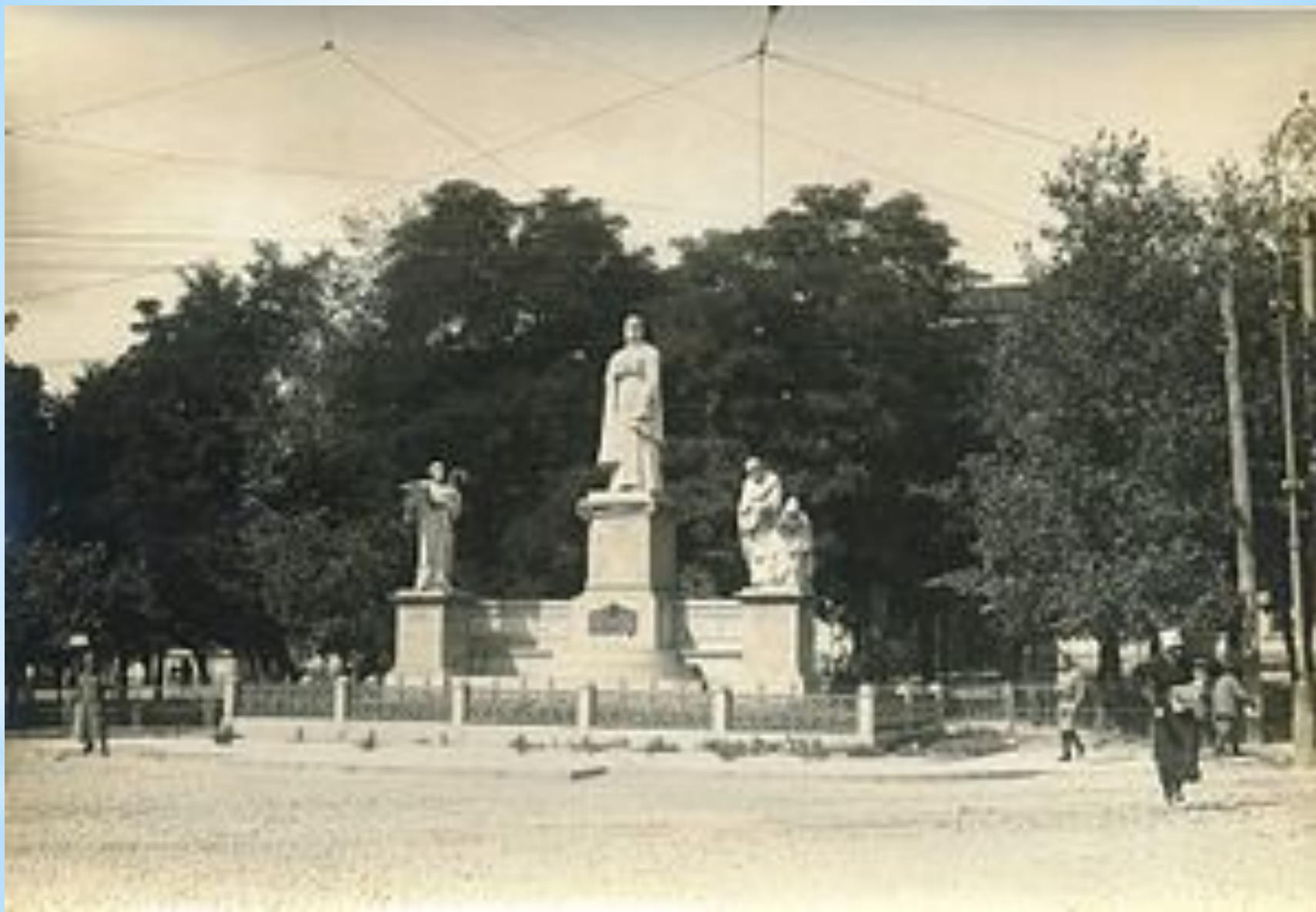
Памятник княгине Ольге в Киеве