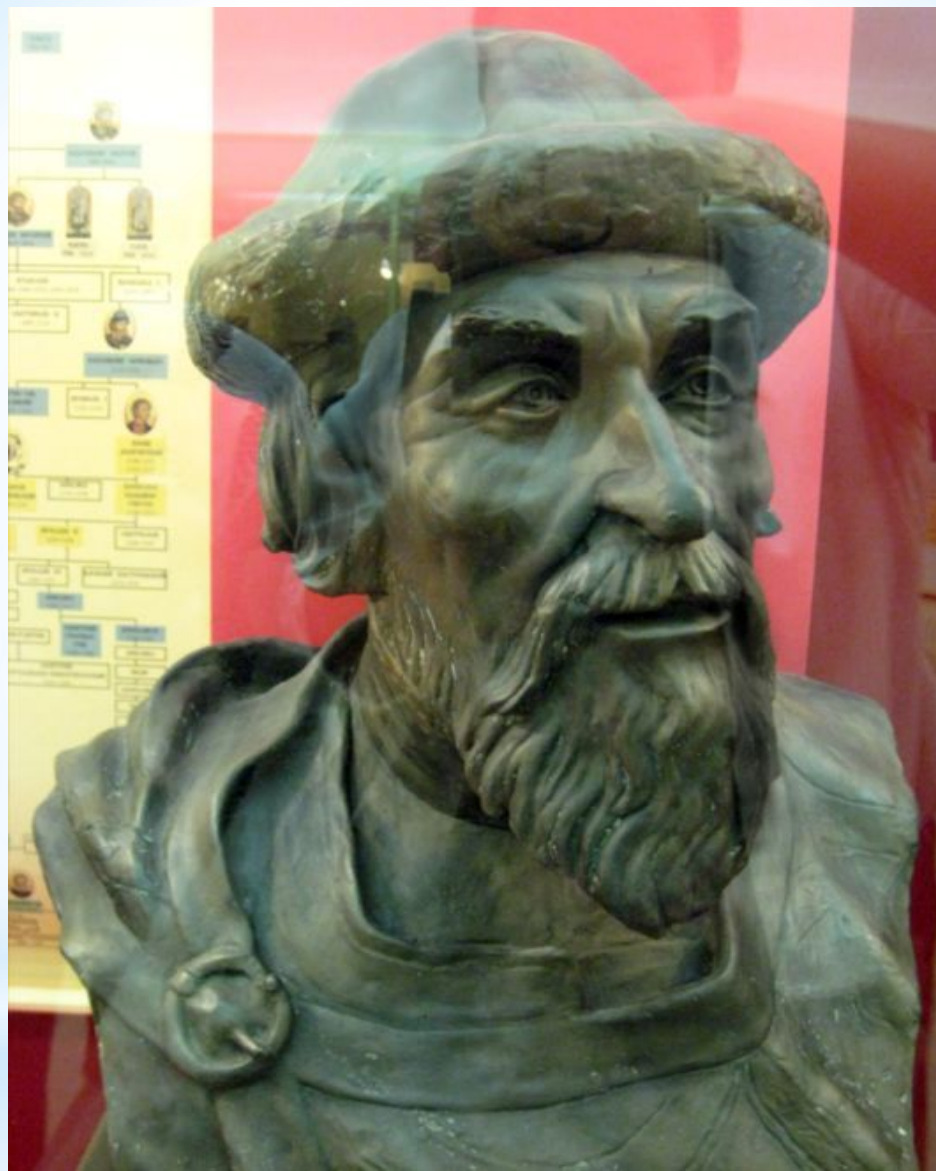
Князь Ярослав Мудрый