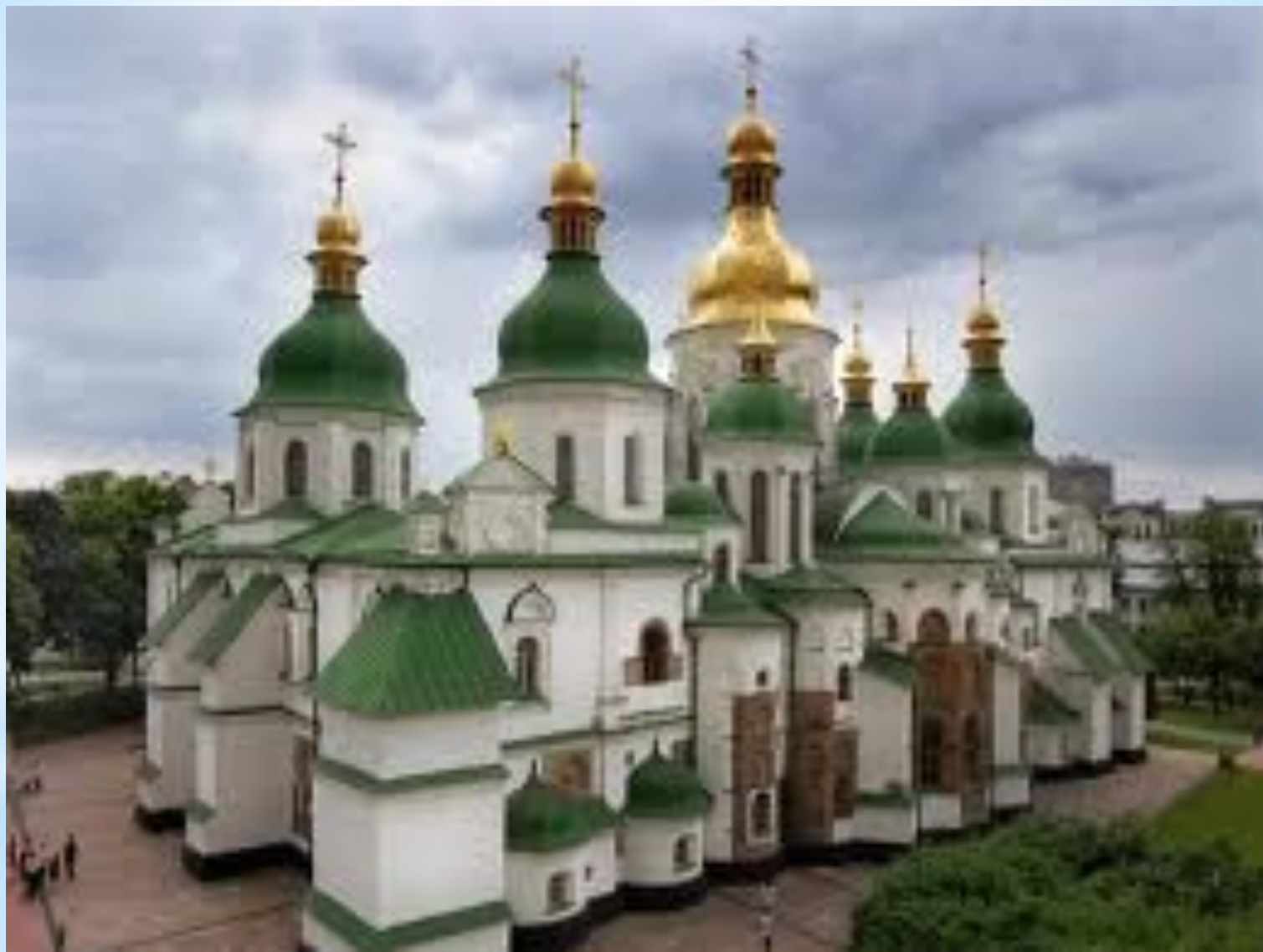
Софийский Собор в Киеве