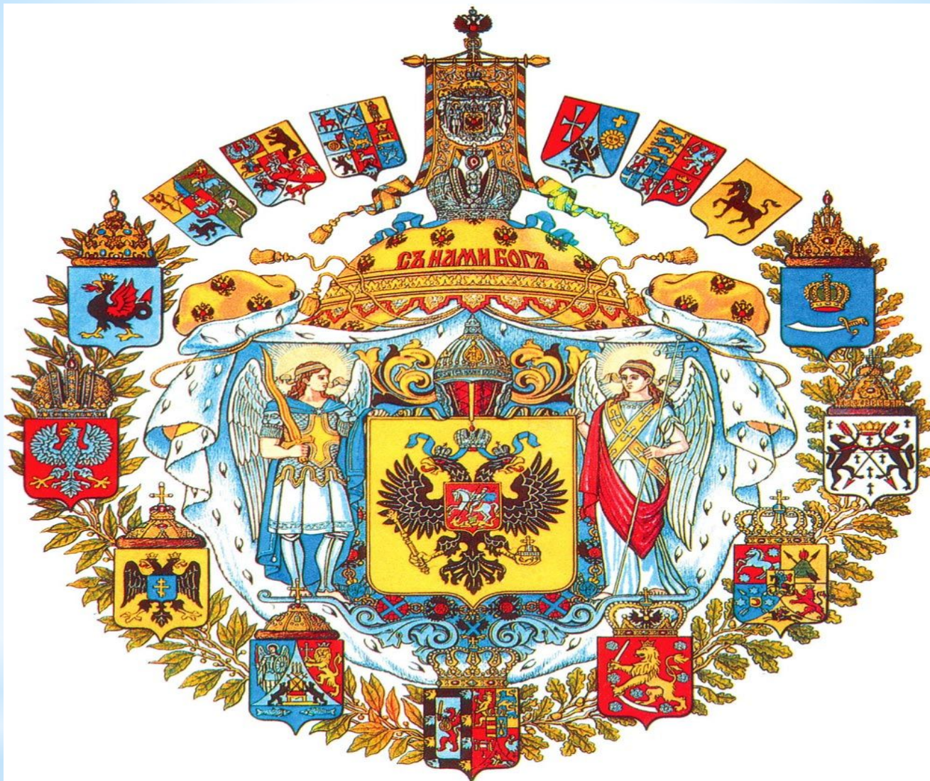
Герб Киевской Руси