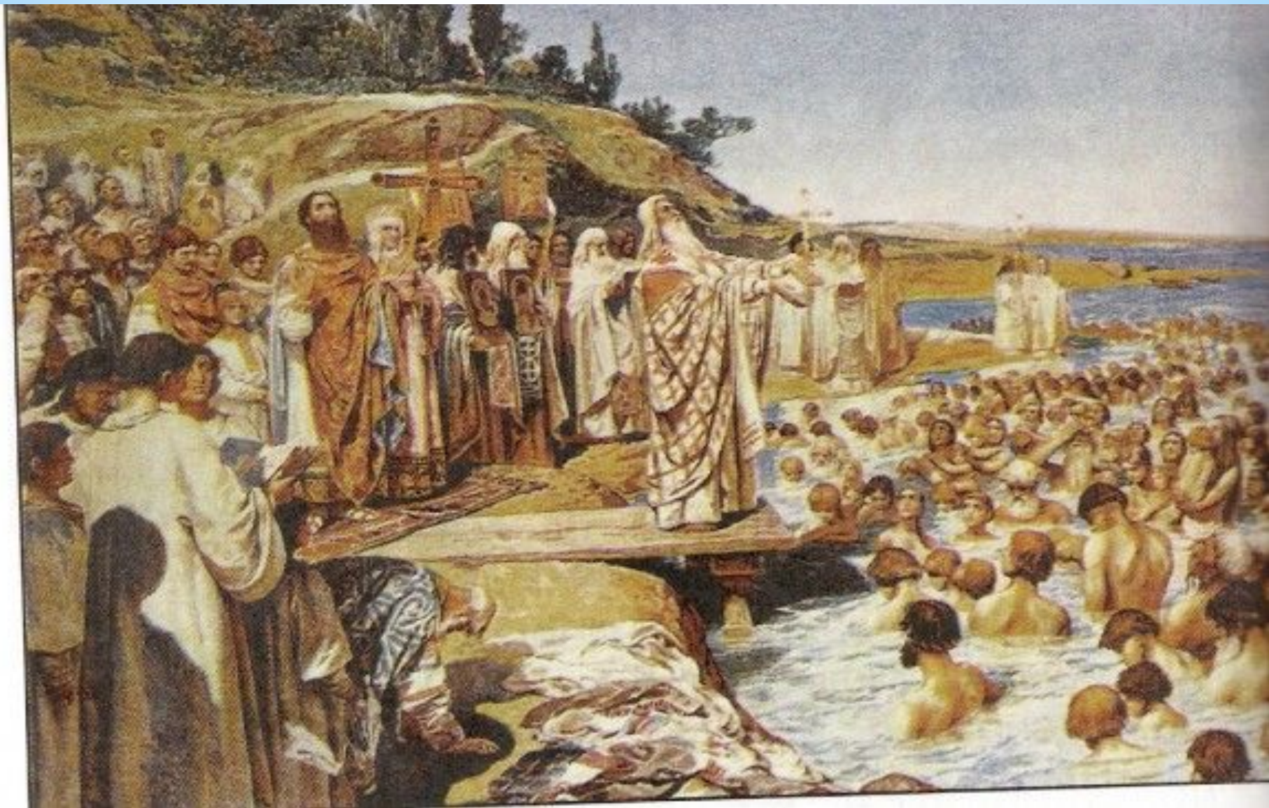
Крещение в Киеве