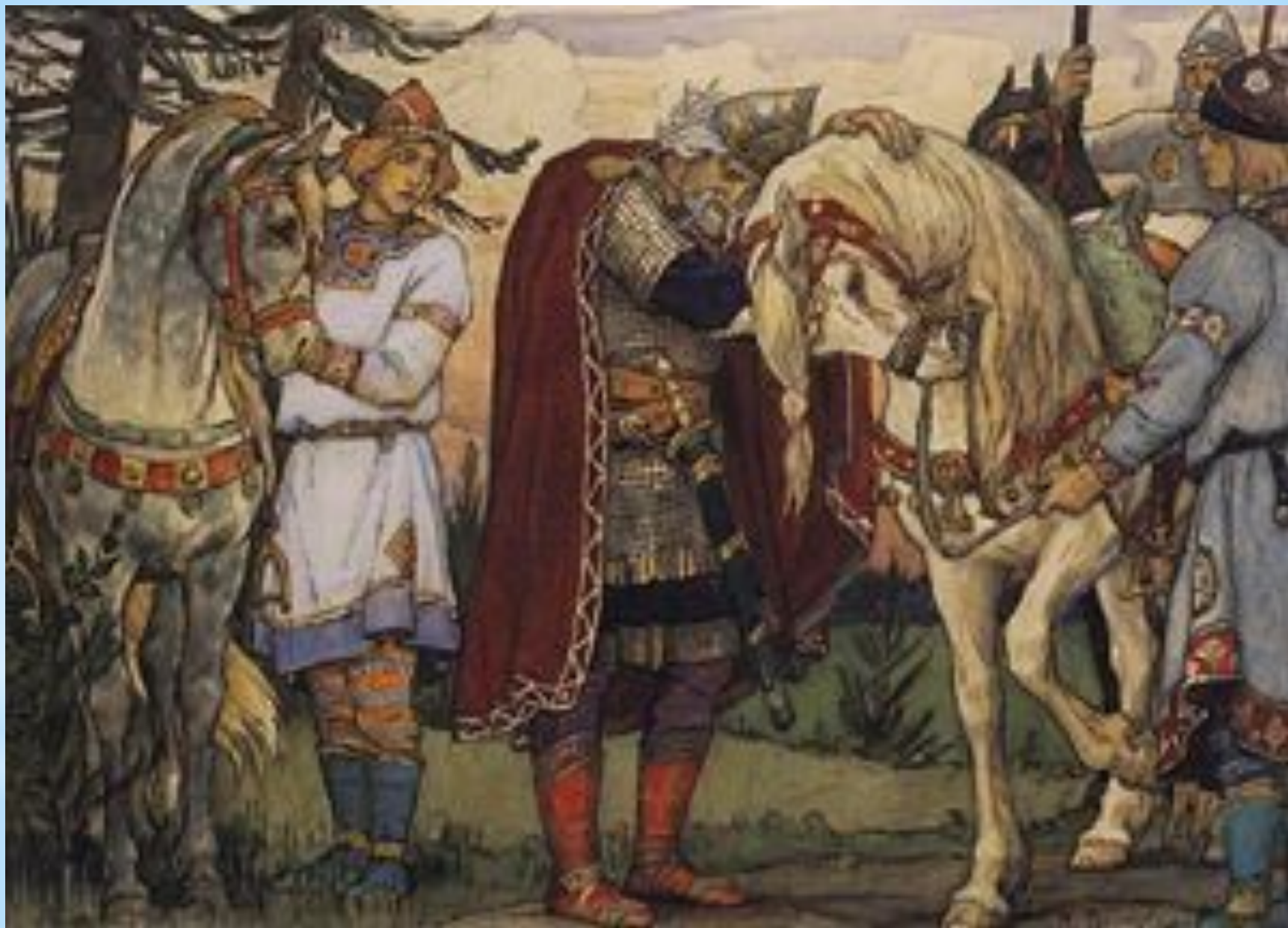
Прощание Вещего Олега с конем