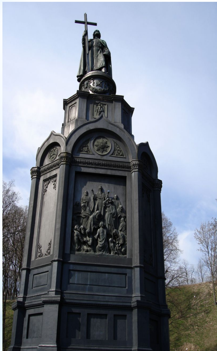
Памятник Владимиру в Киеве