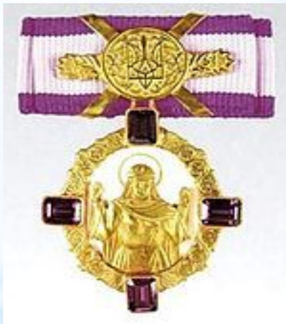
Орден княгини Ольги / степени