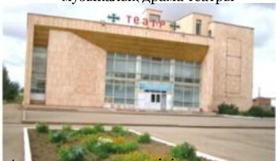
Арқалық қазақ жасөспірімдер театры