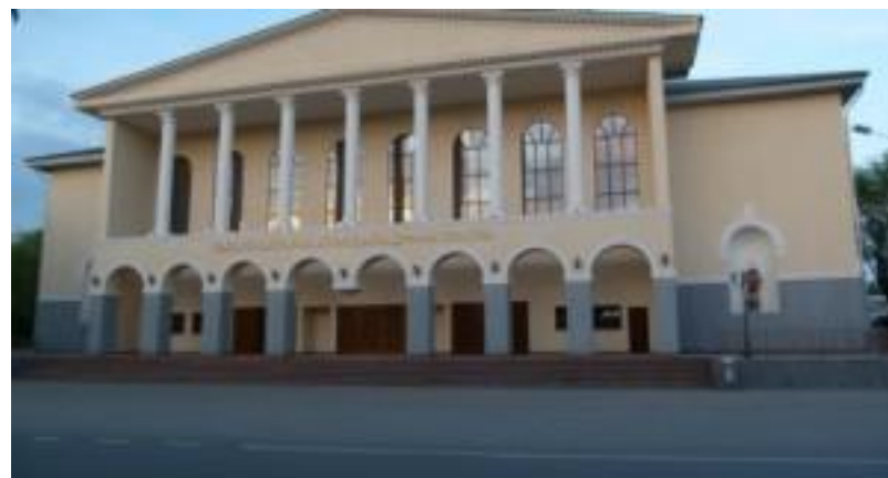
Т.Ахтанов атындағы Ақтөбе облыстық драма театры