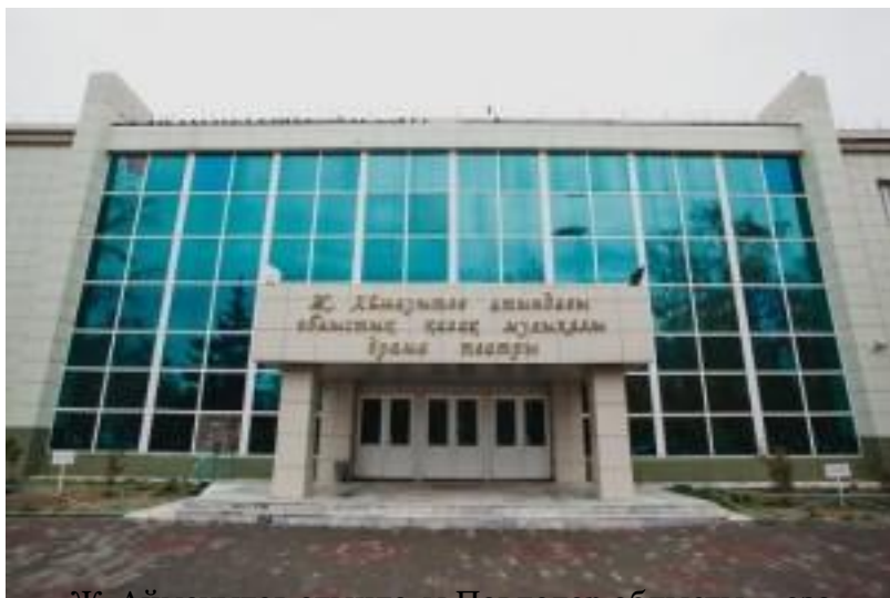
Ж. Аймауытов атындағы Павлодар облыстық қазақ музыкалық драма театры