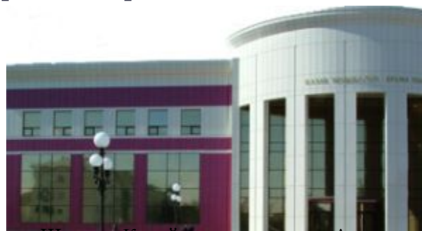
Шахмет Құсайынов атындағы Ақмола облыстық қазақ музыкалық драма театры