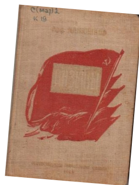
ЛХМИ КП 55