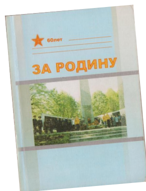
ЛХМИ КП 989