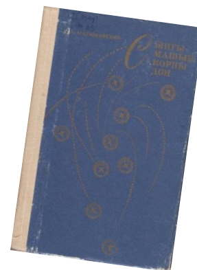
ЛХМИ КП 222

Использованы материалы из фондов музея им. Н. Игнатьева