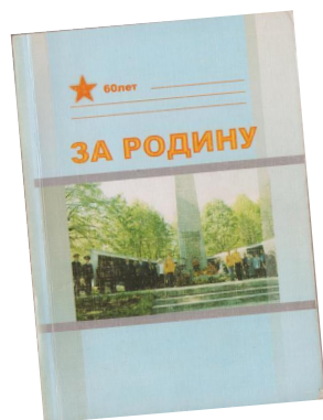
ЛХМИ КП 989