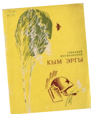
ЛХМИ КП 223

К 60-летию Победы издан тематический сборник «За Родину», посвященный памяти писателей-фронтовиков Горномарийского района. Эти бесценные книги, которые хранятся в нашем музее, мы предлагаем обязательно прочитать.