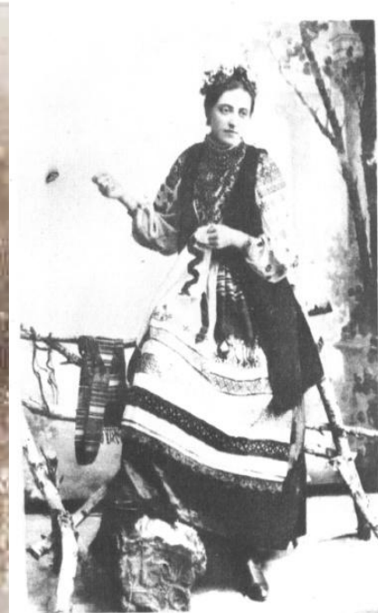
Соломія Крушельницька Соломія Крушельницька в подільському народному одязі. (Перша половина 90-х років XIX століття)