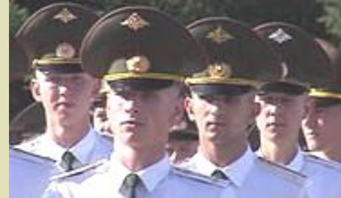
Курсанты военных высших учебных заведений

Высокий уровень подготовки профессорско-преподавательского состава Диплом государственного образца Обеспечивают родители Стипендия 2 тыс. руб. Нет бесплатного проезда к месту проведения каникул