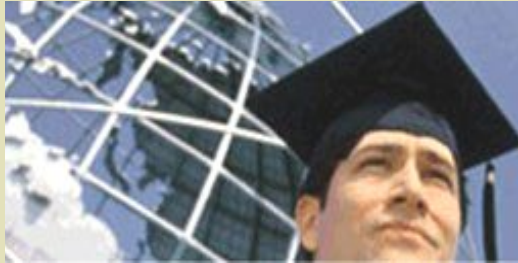
Студенты гражданских высших учебных заведений

Ежегодная плата за обучение 100 тыс. руб и более Престижные специальности Современные технологии и средства обучения, технически оснащенная учебная база