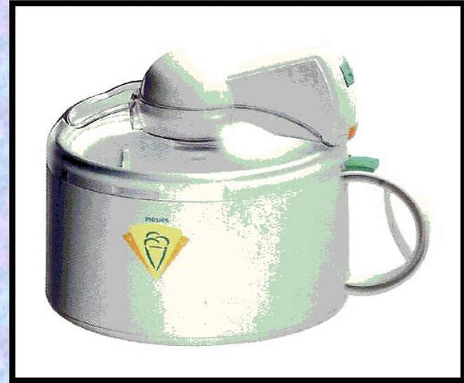
Электрическая мороженица 20 века

В 1846 г. Ненси Джонсон изобрела аппарат для домашнего приготовления мороженого. Аппарат назывался ручной фризер .