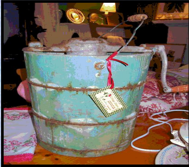
Деревянная мороженица 19 века