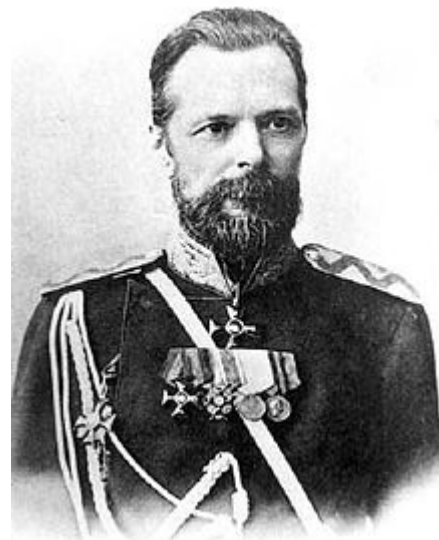
Альфонс Леонович Шанявский. Фото. Конец XIX в.