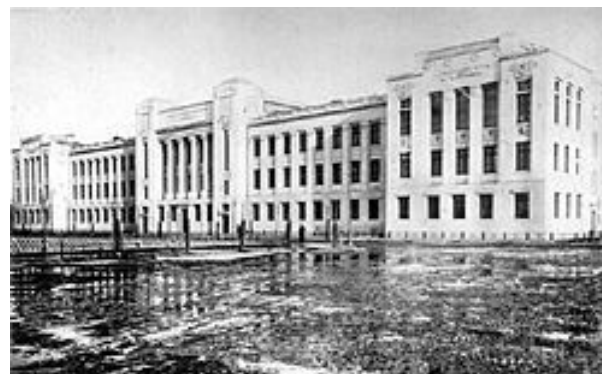
Московский Городской народный университет имени А. Л. Шанявского