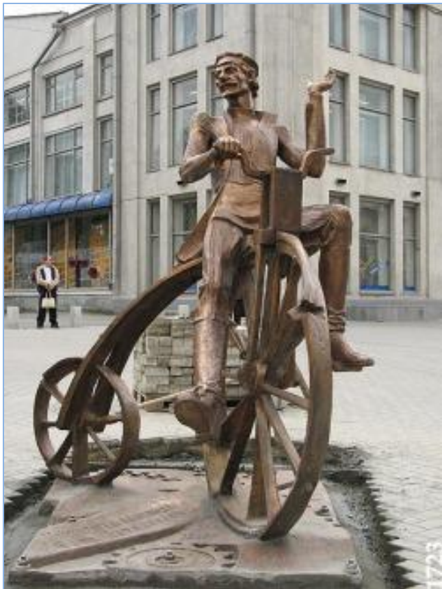
Велосипед мастера Артамонова 1800 год