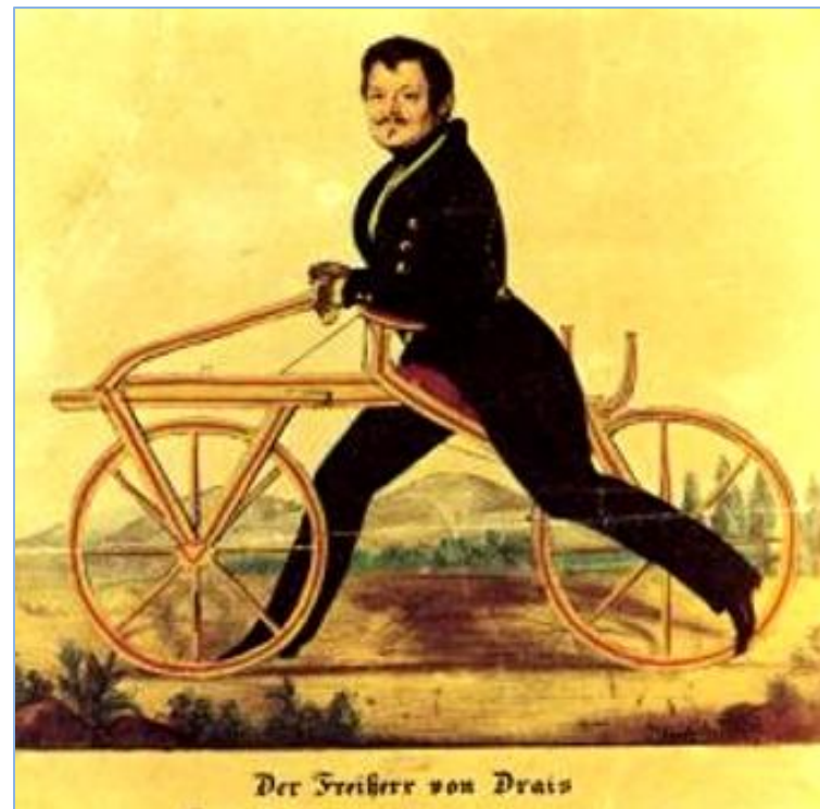
Велосипед барона Карла Дрейза