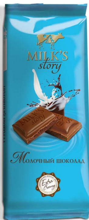
■ Шоколад Молочный 90 гр