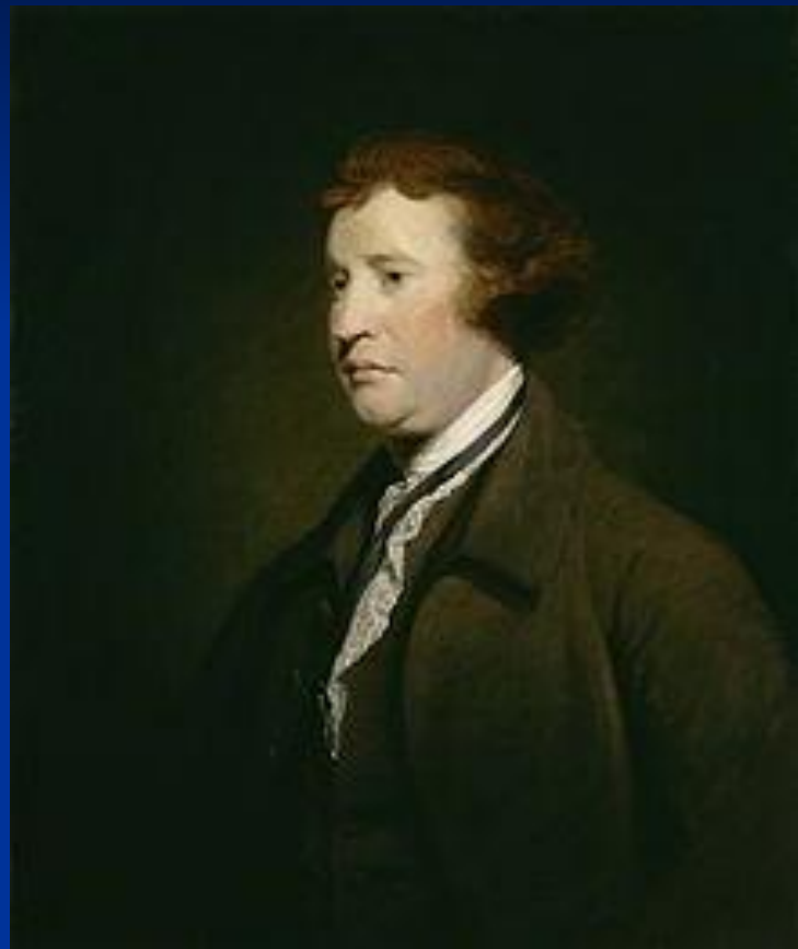
англичанин Эдмунд Бёрк (1729-1797)