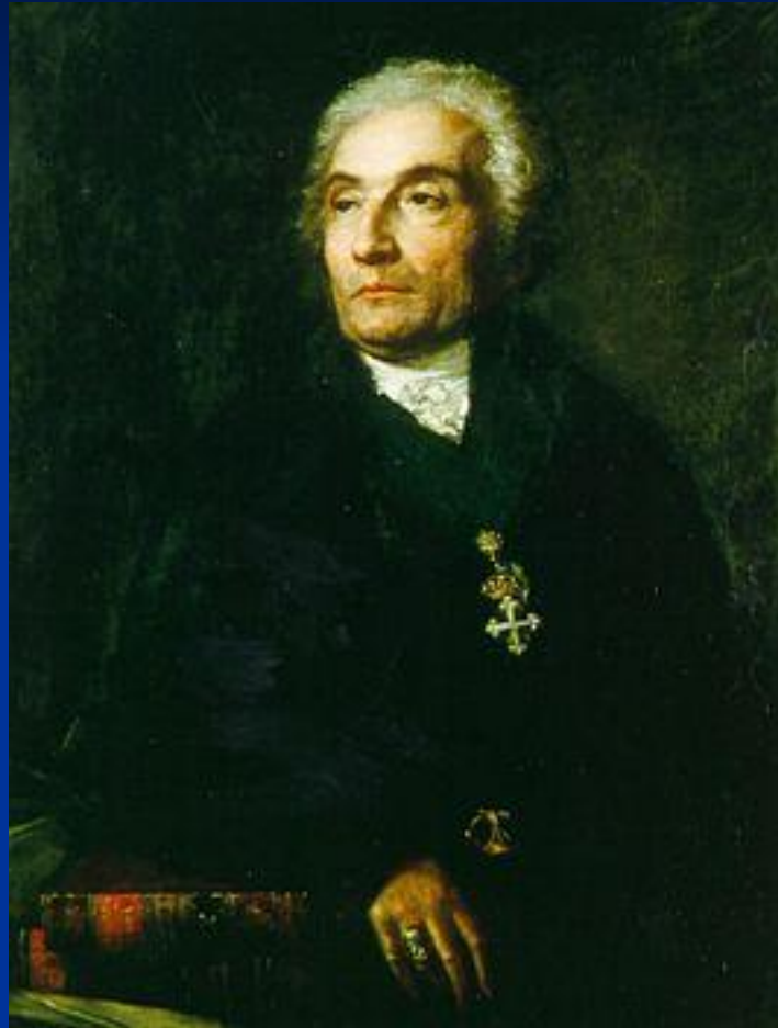
Жозеф де Местр (1753—1821)