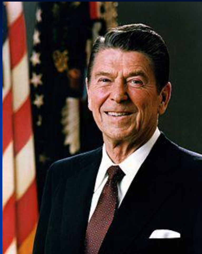
Рональд Рейган (1911-2004) 40-й президент США (1981-1989)