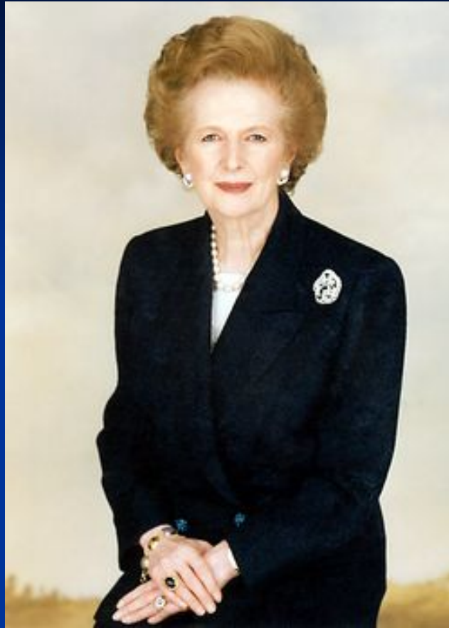
Маргарет Тэтчер (1925-2013) 71-й Премьер-министр Великобритании (1979-1990)