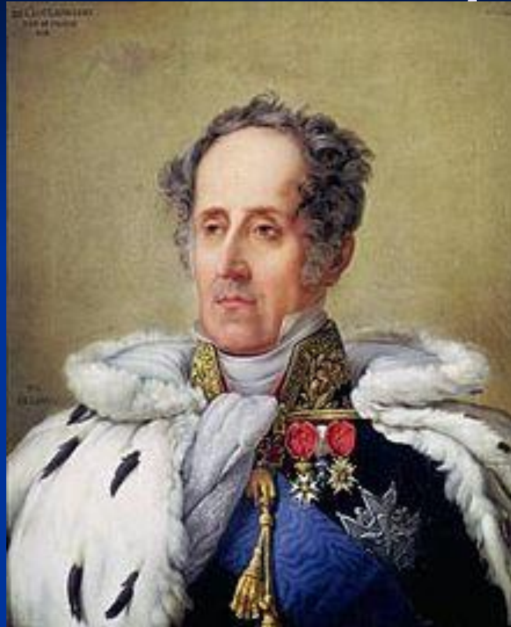
Франсуа Рене де Шатобриан (1768-1848)