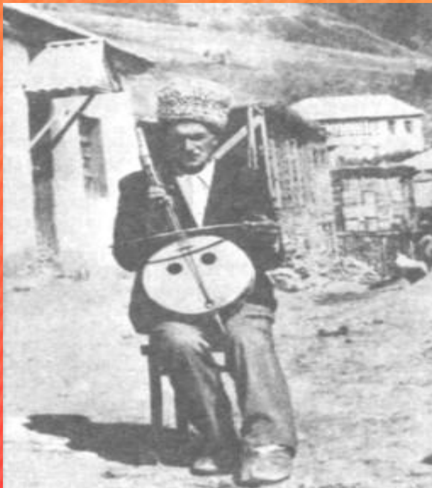
Национальный инструмент - чагана

Аварцы — самый многочисленный народ современного Дагестана