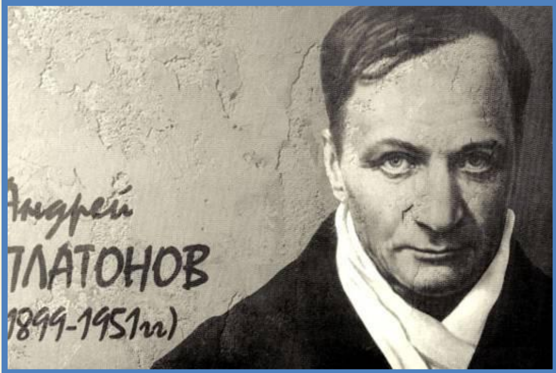
Андрей ПЛАТОНОВ 1899-1951гг)