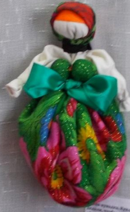
Кукла оберег «Берегиня» - кукла из белой ткани, оберег от болезней.