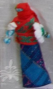
Кукла «Берегиня» - кукла из белой ткани, оберег от болезней.