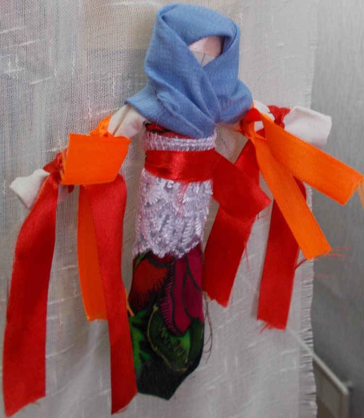
Кукла - желанница. Исполняет желания.