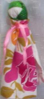
Кукла «Берегиня» - кукла из белой ткани, оберег от болезней.