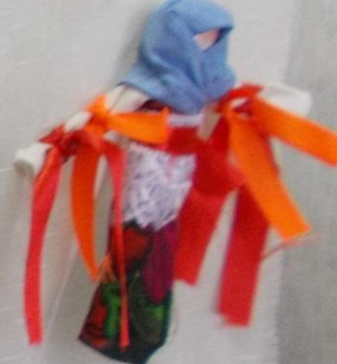
Кукла оберег «Берегиня» - кукла из белой ткани, оберег от болезней.