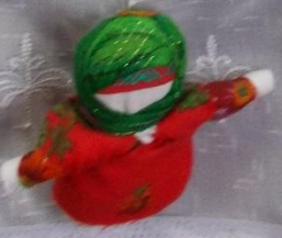
Кукла «Берегиня» - кукла из белой ткани, оберег от болезней.