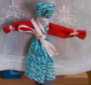
Кукла «Берегиня» - кукла из белой ткани, оберег от болезней.