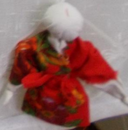
Кукла «Берегиня» - кукла из белой ткани, оберег от болезней.