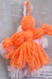
Кукла «Берегиня» - кукла из белой ткани, оберег от болезней.