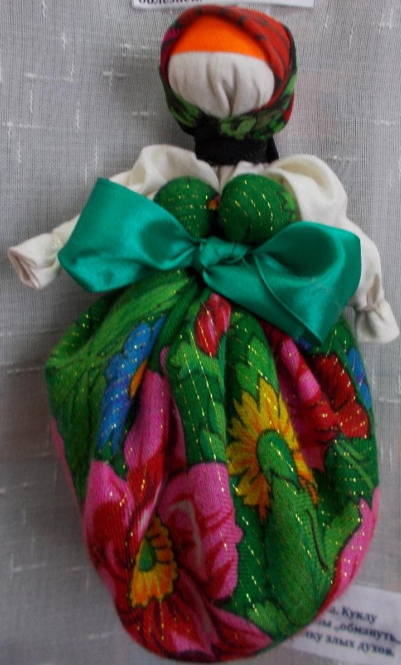
Куклу обмануть, от злых духов.