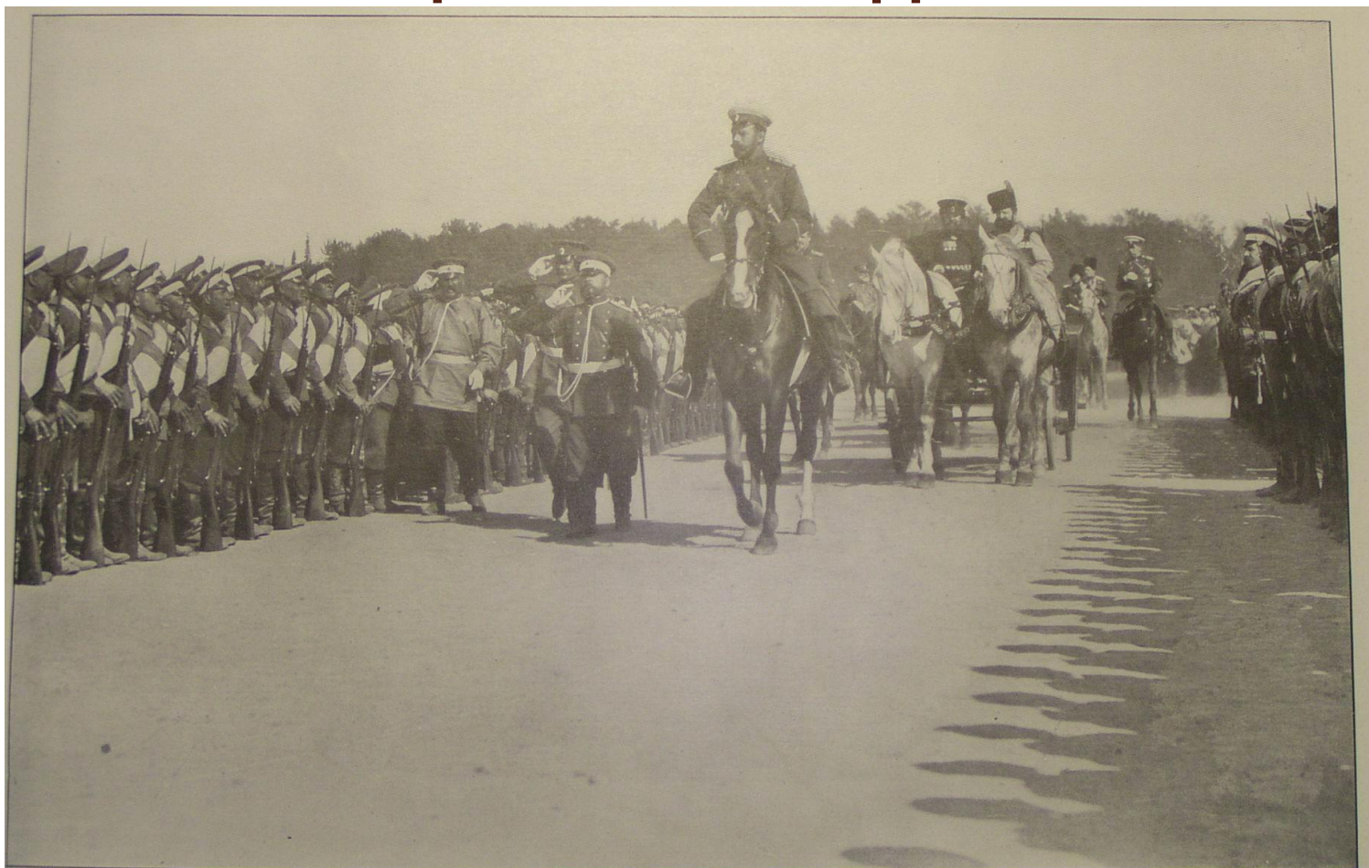
THE CZAR REVIEWING AN INFANTRY REGIMENT ON ITS DEPARTURE FOR THE FRONT