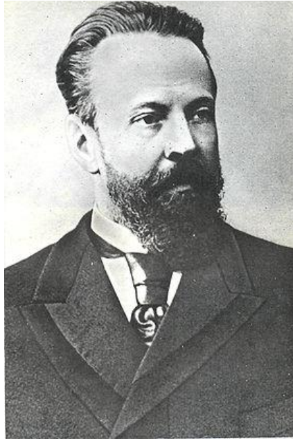
С.Ю. Витте крупнейший государственный деятель России рубежа XIX – XX вв., министр финансов, председатель Совета министров (1905-1906 гг)