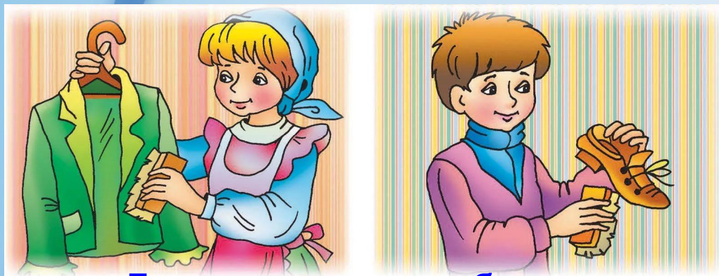
Гигиена одежды и обуви