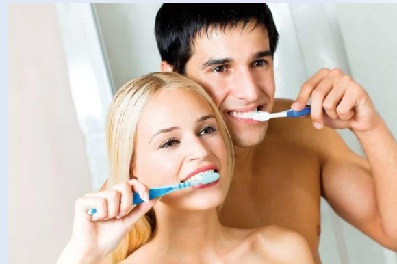
Гигиена полости рта