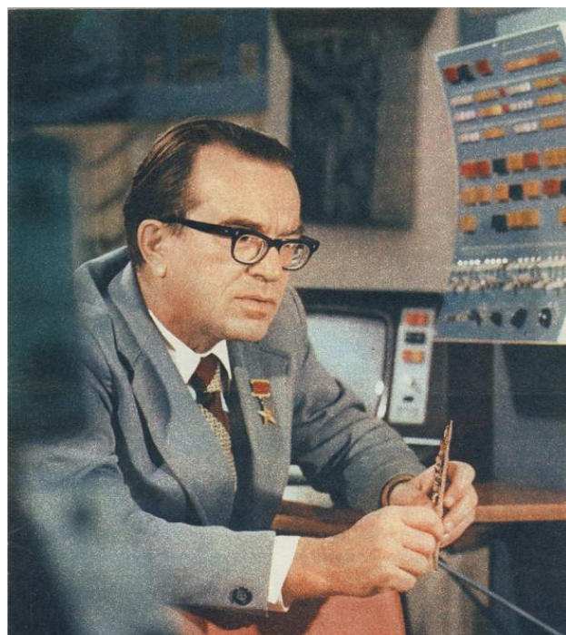
Віктор Михайлович Глушков

Впровадження інформаційних систем в світі