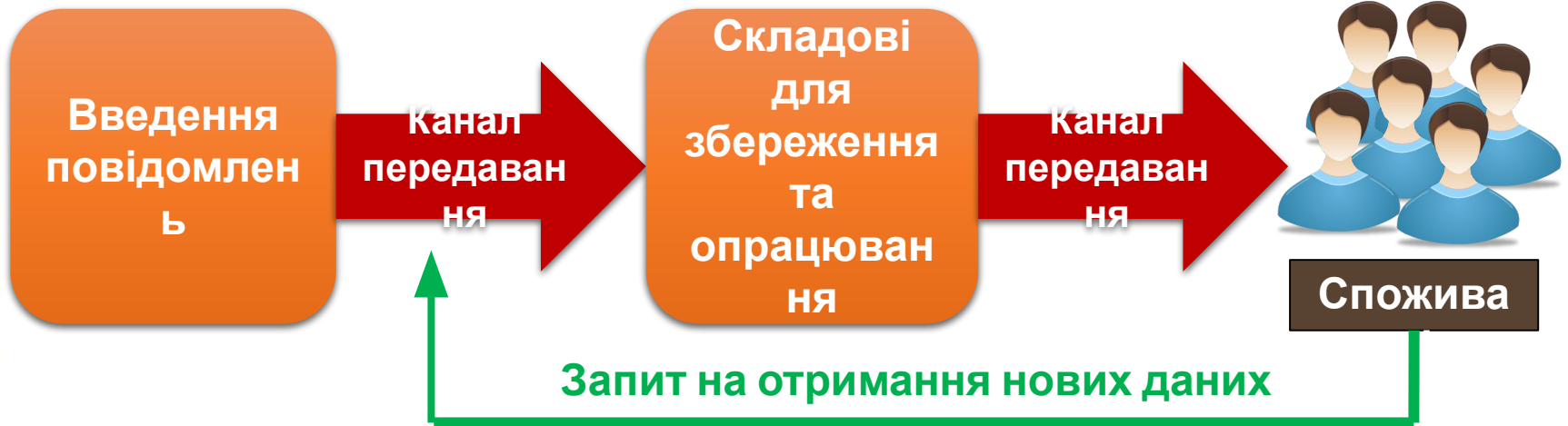
Схема роботи інформаційних систем