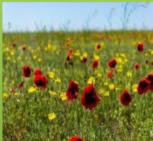
10. Растение, произрастающие в Урочище Кордон.