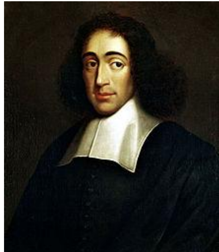
Бенедикт (Барух) Спиноза(1632-1677)