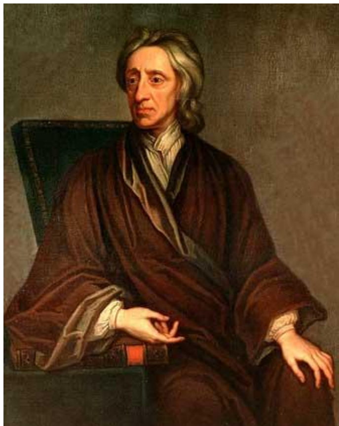
Джон Локк (1632-1704)