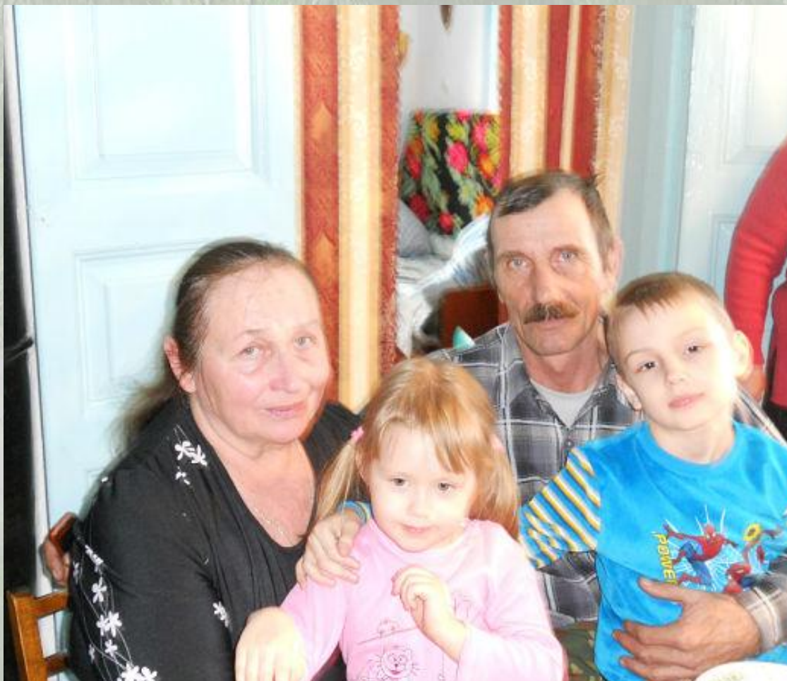
Александр Сергеевич с женой и внуками