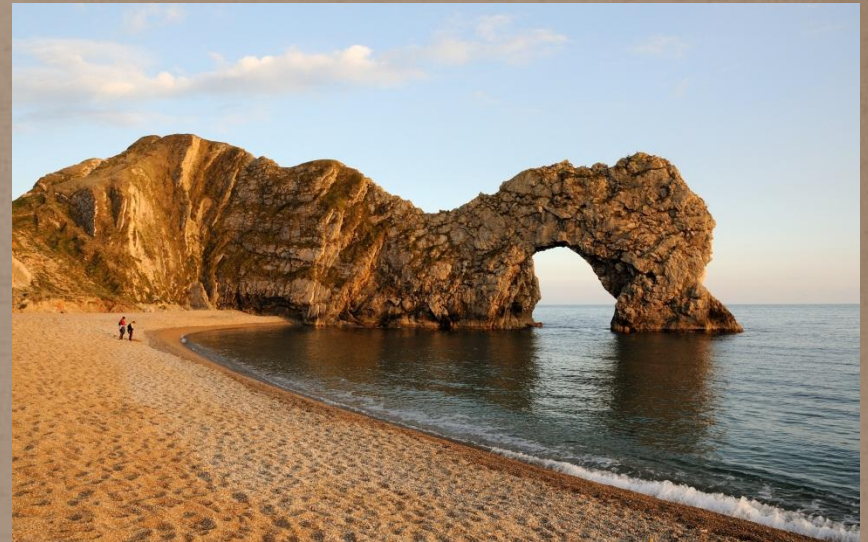
Юрське узбережжя Дорсета і Східного Девону