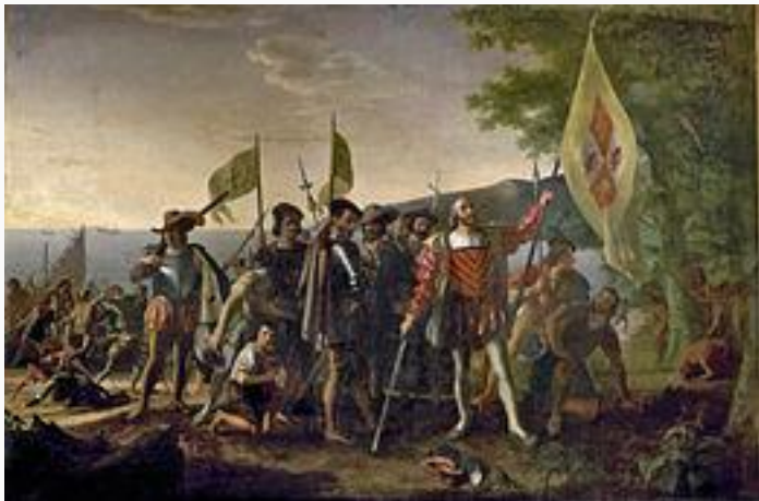
Высадка Колумба в Америке

Колумб родился в небогатой генуэзской семье, его отцом был Доменико Коломбо, а матью — Сузанна Фонтанаросса.