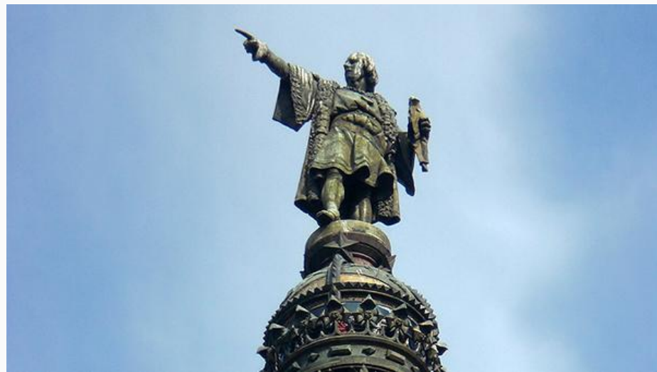
Памятник Христофору Колумбу в Испании (Барселона)

В ходе экспедиции осуществлено полное покорение Эспаньолы, начато массовое истребление местного населения. Заложен город Санто-Доминго. Проложен наиболее удобный морской путь в Вест-Индию. Открыты Малые Антильские острова, Виргинские острова, острова Пуэрто-Рико, Ямайка; почти полностью исследовано южное побережье Кубы. При этом Колумб продолжает утверждать, что он находится в Западной Индии.