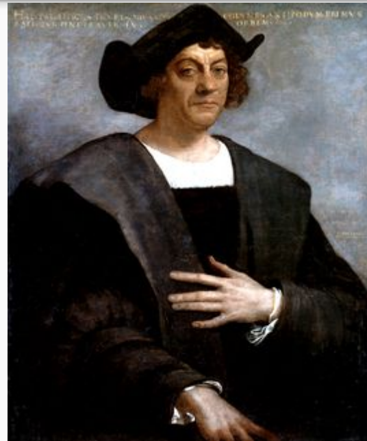
Портрет Христофора Колумба

“И если Вы опасаетесь Нашего правосудия по поводу некоторых Ваших обязательств, то знайте, что ни после Вашего прибытия, ни во время пребывания в Португалии, ни после отъезда, Вы не будете ни арестованы, ни задержаны, ни обвинены, ни осуждены, ни преследуемы по какой-либо причине, вытекающей из гражданского, уголовного или какого-либо другого права.”