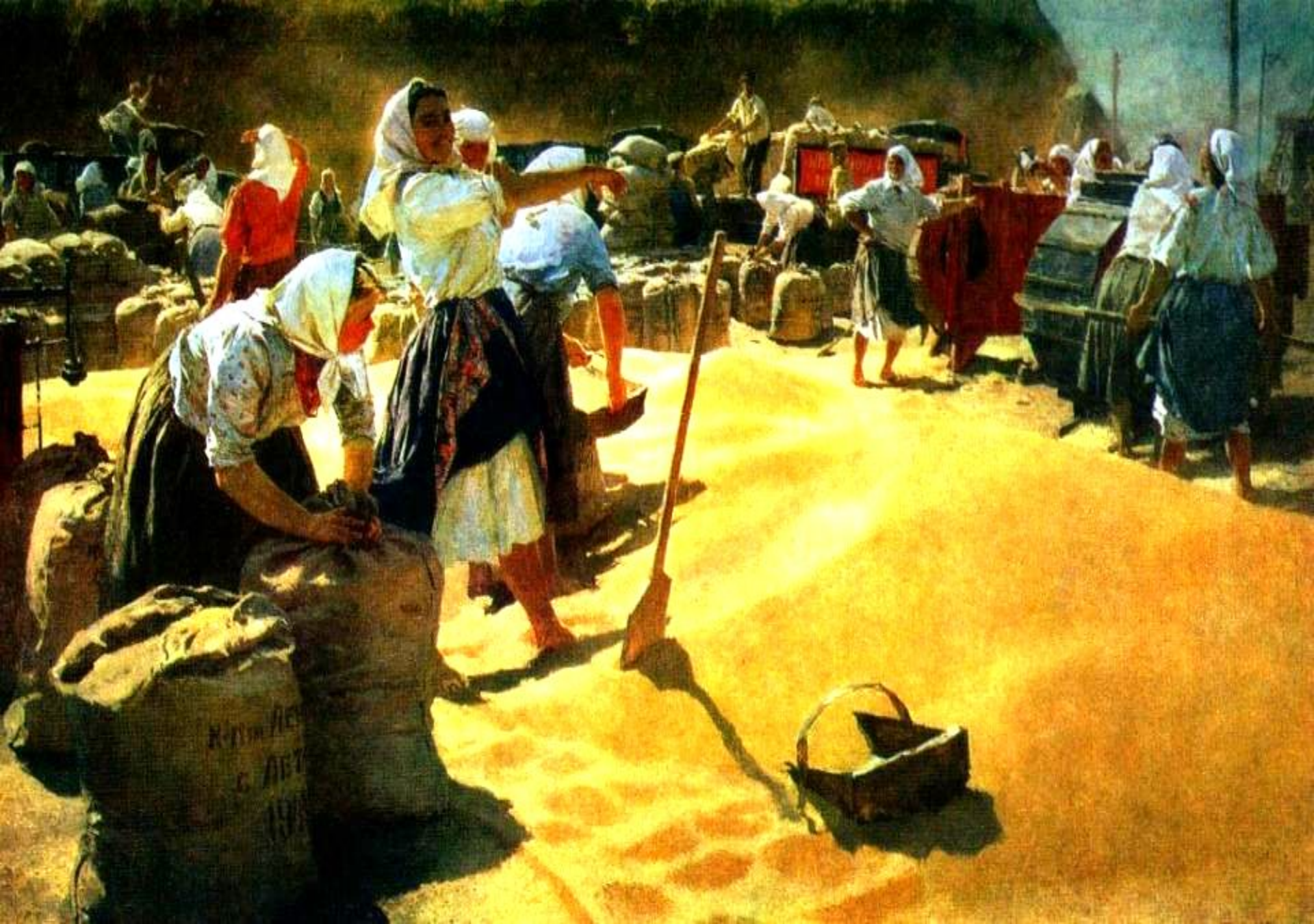
Татьяна Яблонская. Хлеб убирают.