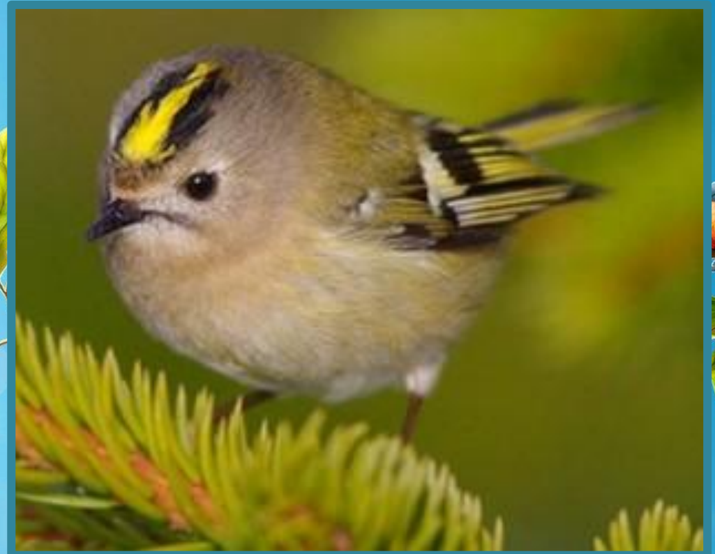
КОРОЛЕК ЖЕЛТОГОЛОВ ЫЙ