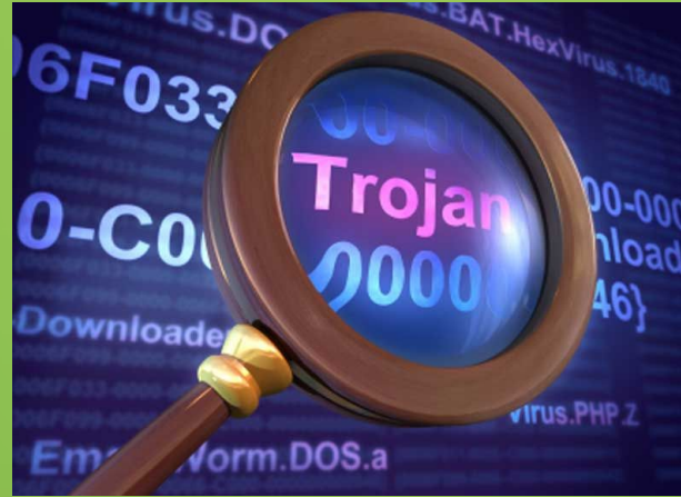
Троянский вирус (Троян)