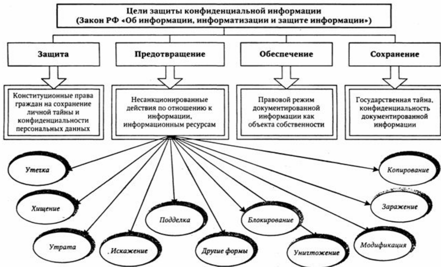
Схема 4. Цели защиты, объекты и угрозы конфиденциальной информации