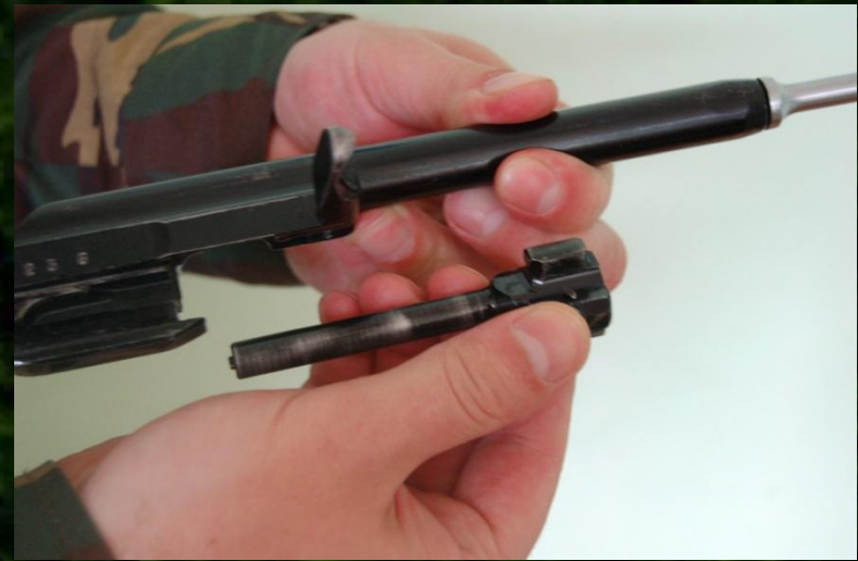
Рис. 7. Отделение затвора от затворной рамы