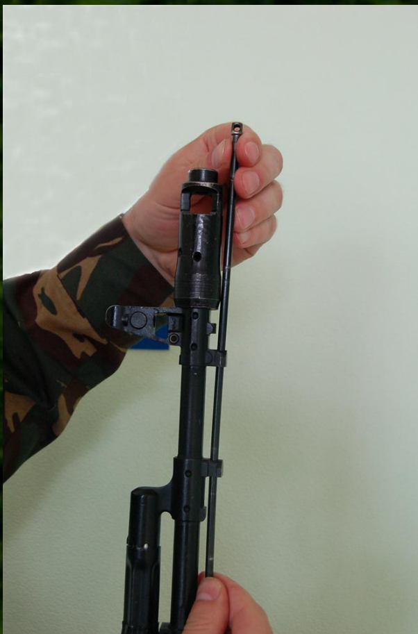
Рис. 3. Отделение шомпола

3. Отделить шомпол. Оттянуть конец шомпола от ствола так, чтобы его головка вышла из-под упора основания мушки (рис. 3), и вынуть шомпол вверх. При отделении шомпола разрешается пользоваться выколоткой.