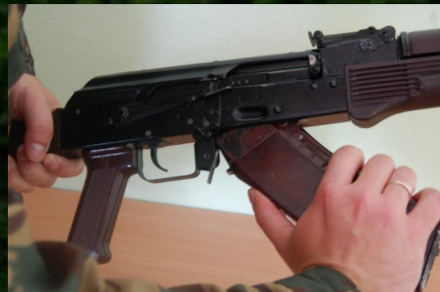
Рис. 1. Отделение магазина