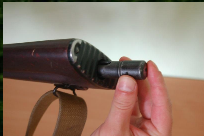
Рис. 2. Вынимание пенала с принадлежностью