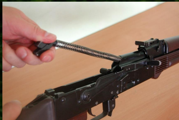
Рис. 5. Отделение возвратного механизма