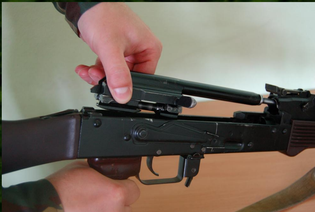
Рис. 6. Отделение затворной рамы с затвором

7. Отделить затворную раму с затвором. Продолжая удерживать автомат левой (правой) рукой, правой (левой) рукой отвести затворную раму назад до отказа, приподнять ее вместе с затвором (рис. 6) и отделить от ствольной коробки.