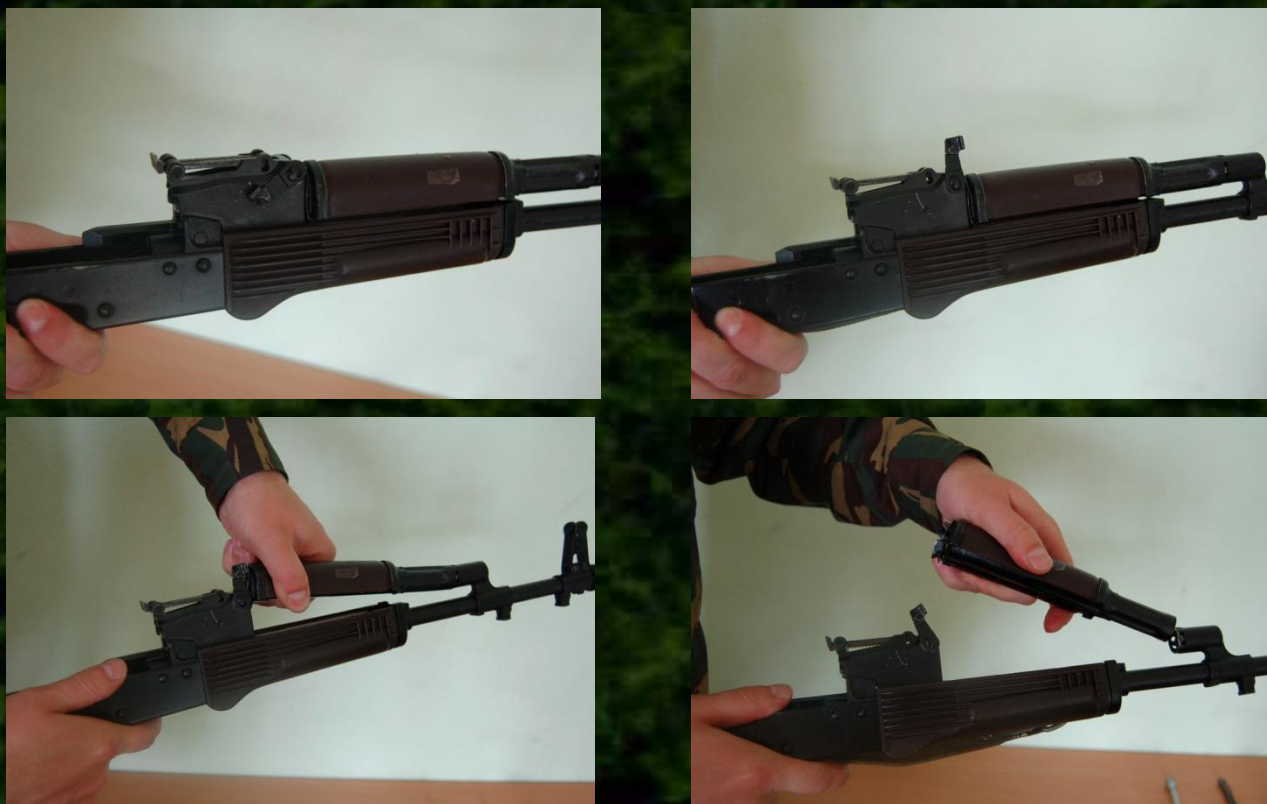
Рис. 8. Отделение газовой трубки со ствольной накладкой

9. Отделить газовую трубку со ствольной накладкой. Удерживая автомат левой рукой, правой рукой надеть пенал принадлежности прямоугольным отверстием на выступ замыкателя газовой трубки, повернуть замыкатель от себя до вертикального положения (рис. 8) и снять газовую трубку с патрубком газовой камеры.