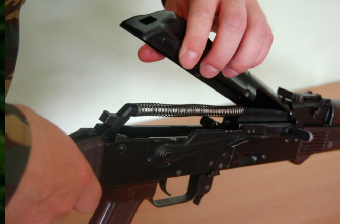
Рис. 4. Отделение крышки ствольной коробки