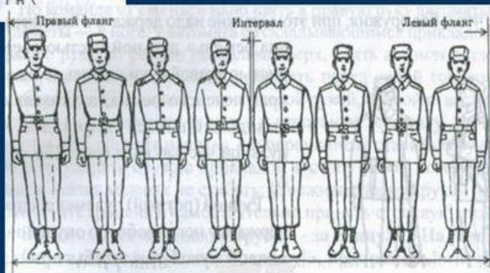
Рис. 125. Одношереножный строй (шеренга) и его элементы.