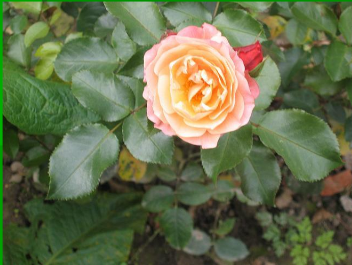
Роза «Мария Кюри»