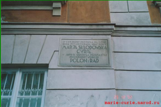
Дом-музей в Варшаве