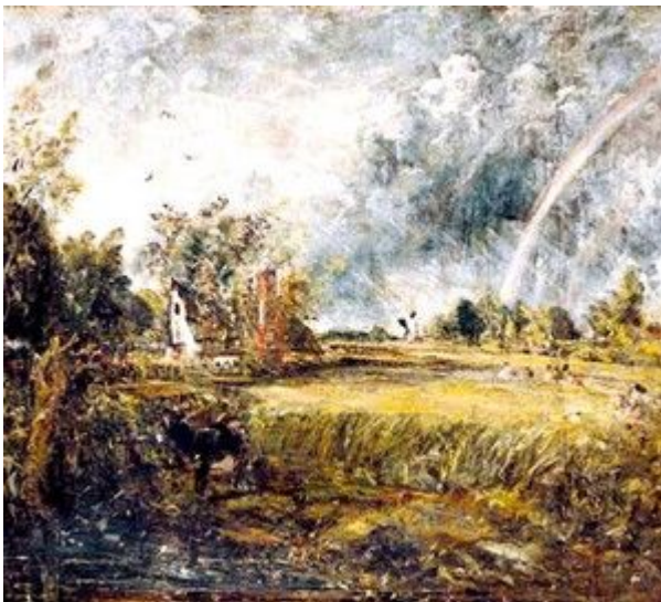
Дом, радуга, мельница

Вместе с тем Констебл оказал заметное влияние на французскую романтическую живопись с ее свободой исполнения и сыграл важную роль в формировании Барбизонской школы, а его энергичная манера живописи и умение создать особое настроение, используя свет, вдохновили художников-импрессионистов, которые унаследовали от него интерес к переменчивым состояниям природы.