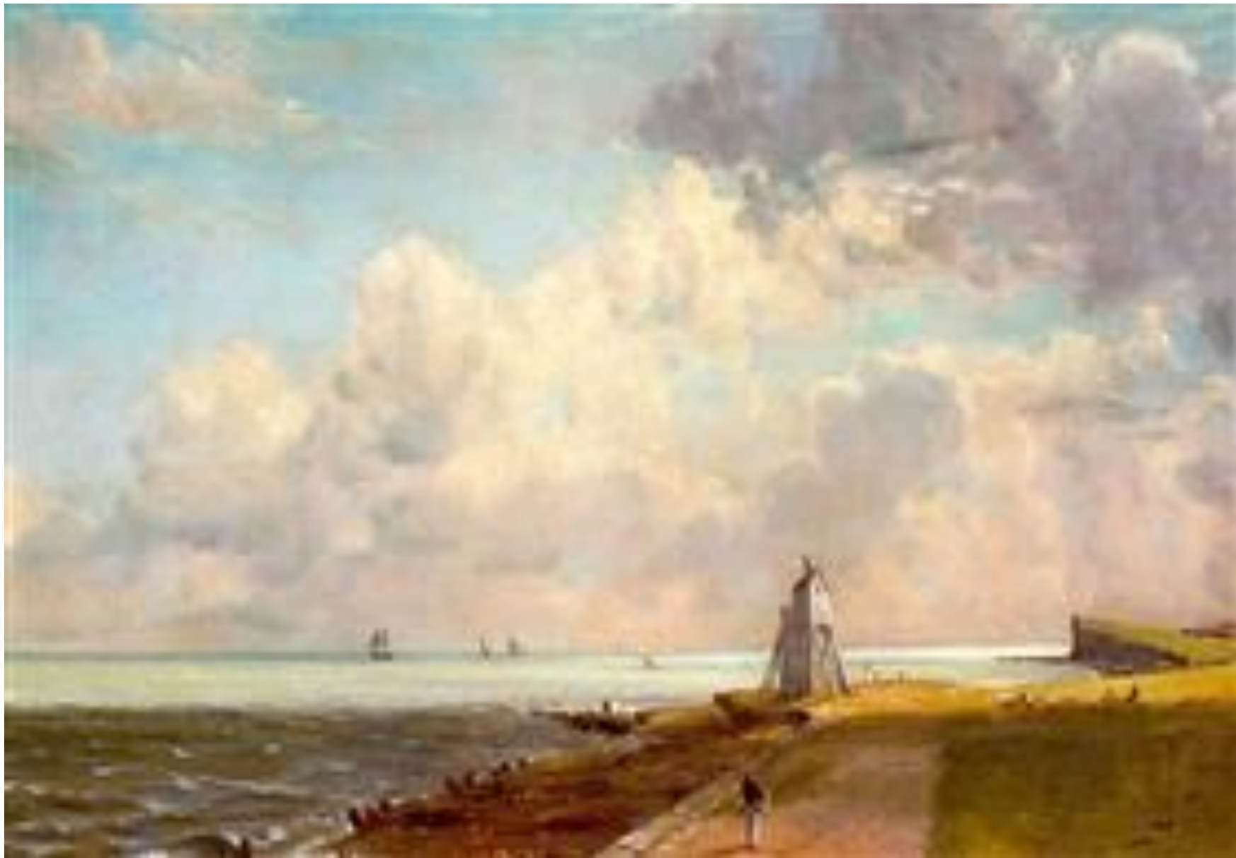
Низкий маяк Бикон-Хилл