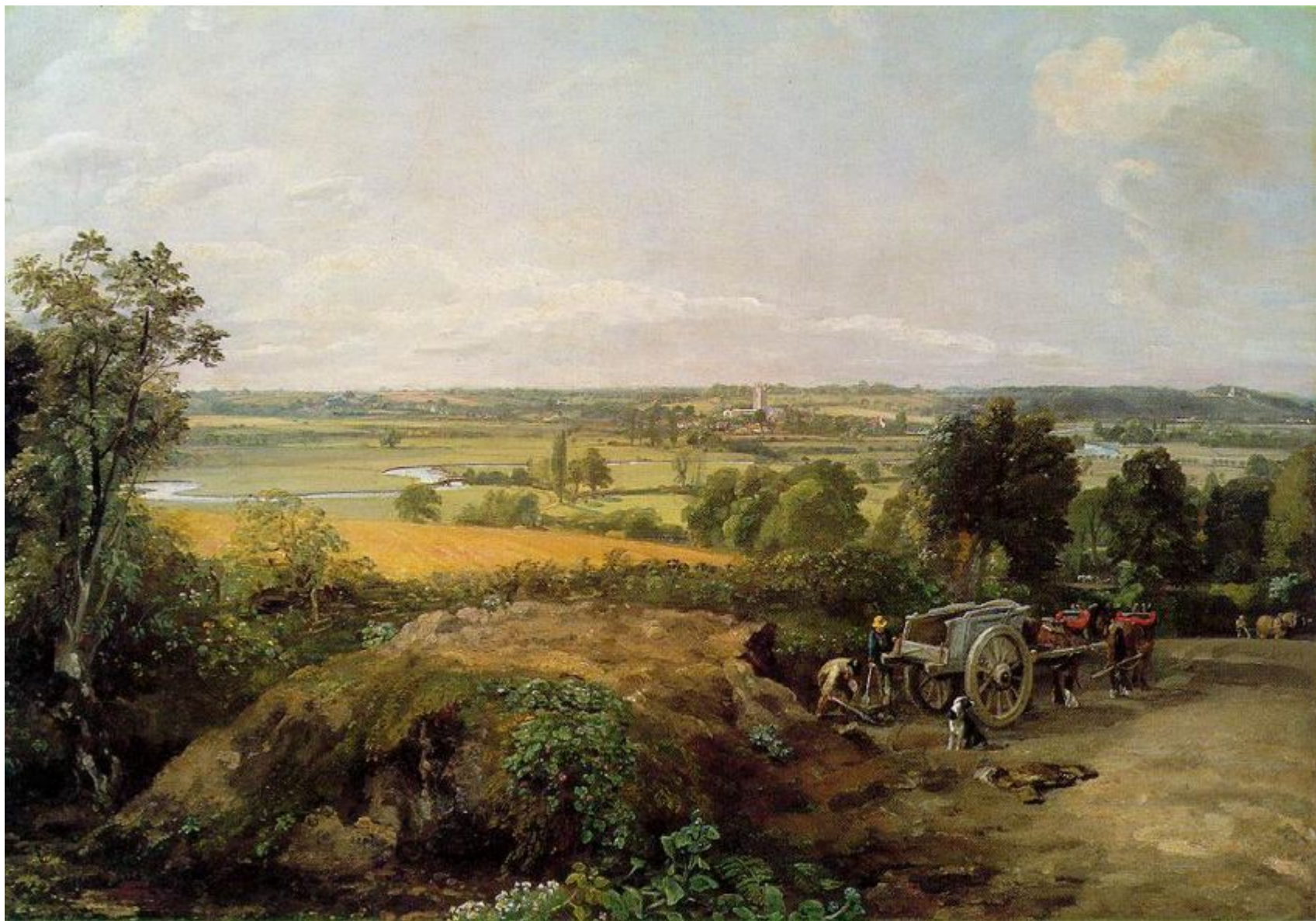
Долина реки Стур с дедхемской церковью . 1814

Констебл создал большую серию пейзажей с видами реки Стур