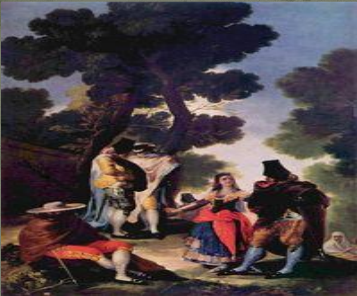
«Маха на прогулянці» 1777 р. Франциско Гойя