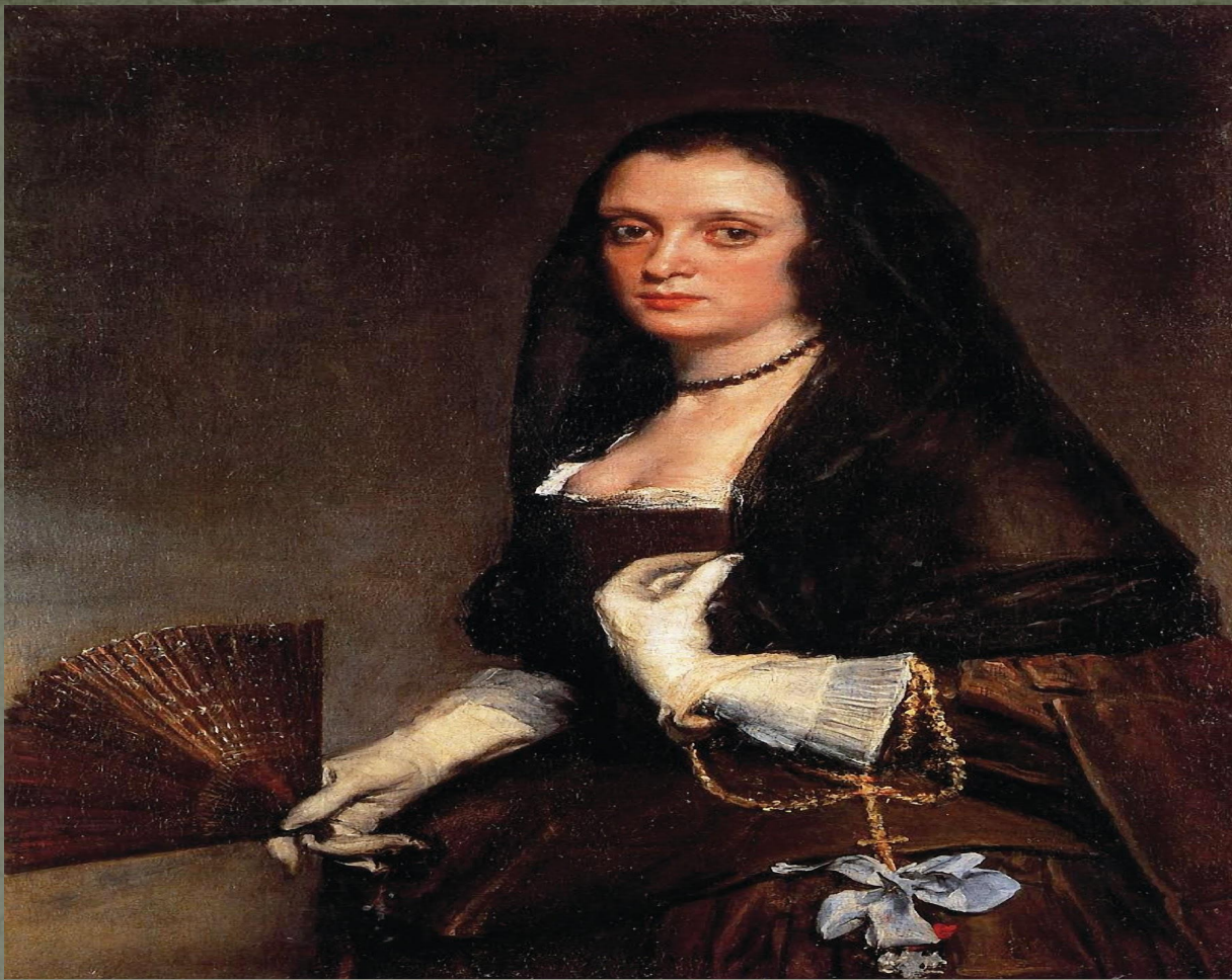
«Дама з віялом» Дієго Веласкес