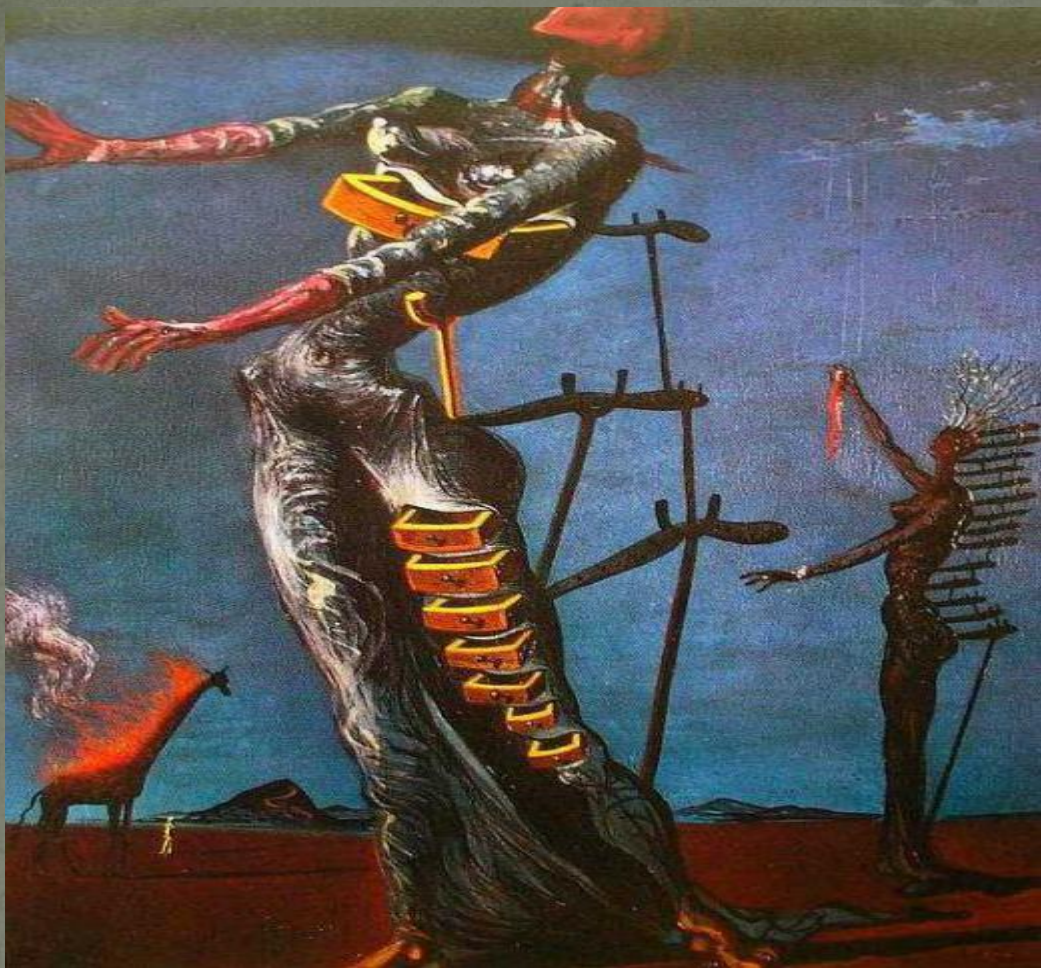
«Жираф в огні» 1937 р. Сальвадор Далі