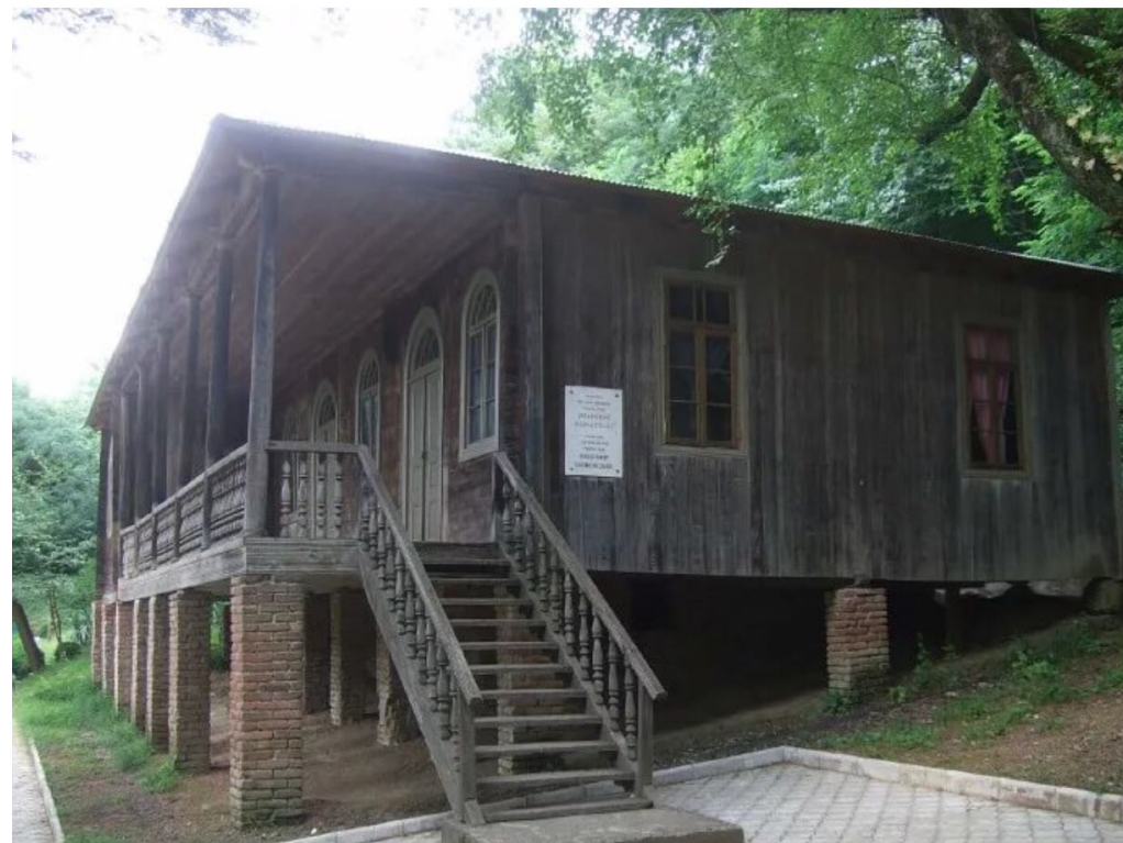
Дом Семьи Маяковского