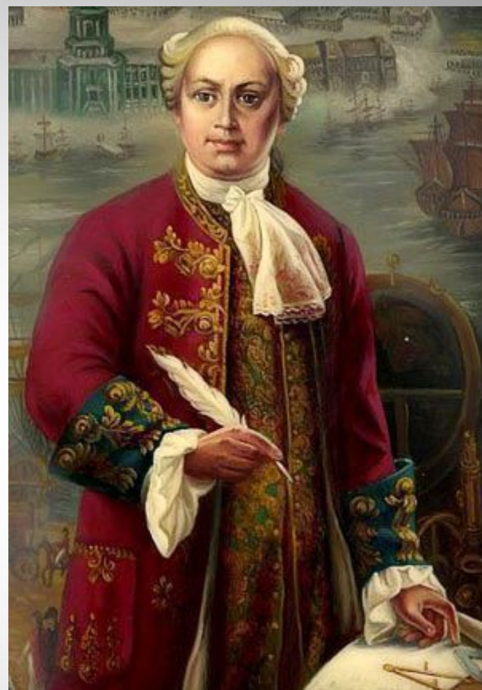
Неизвестный художник XVIII век «М.В.Ломоносов»