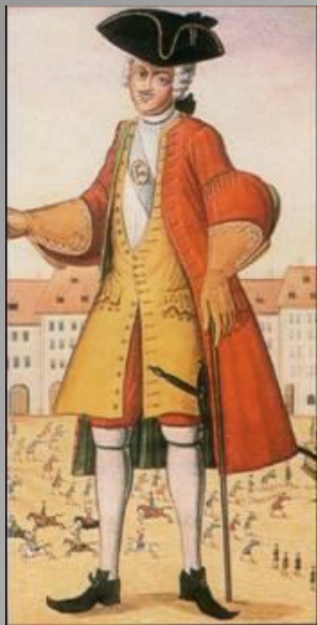
Студент немецкого университета