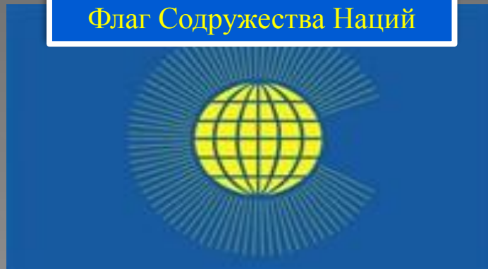
Флаг Содружества Наций