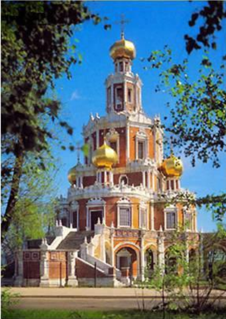
Церковь Покрова в Филях (нарышкинское барокко)