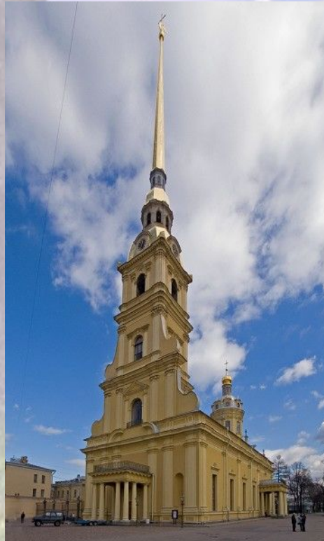
Д.Трезини Петропавловский собор (петровское барокко)