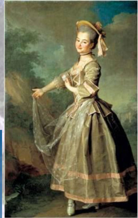
Д.Левицкий «Портрет воспитанницы Смольного Института»