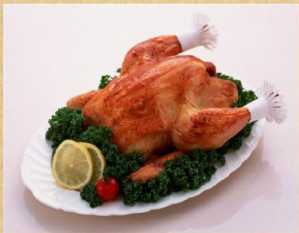
Оформление блюд из курицы