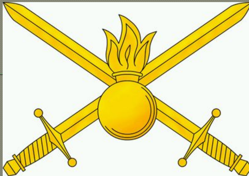
Малая эмблема СВ