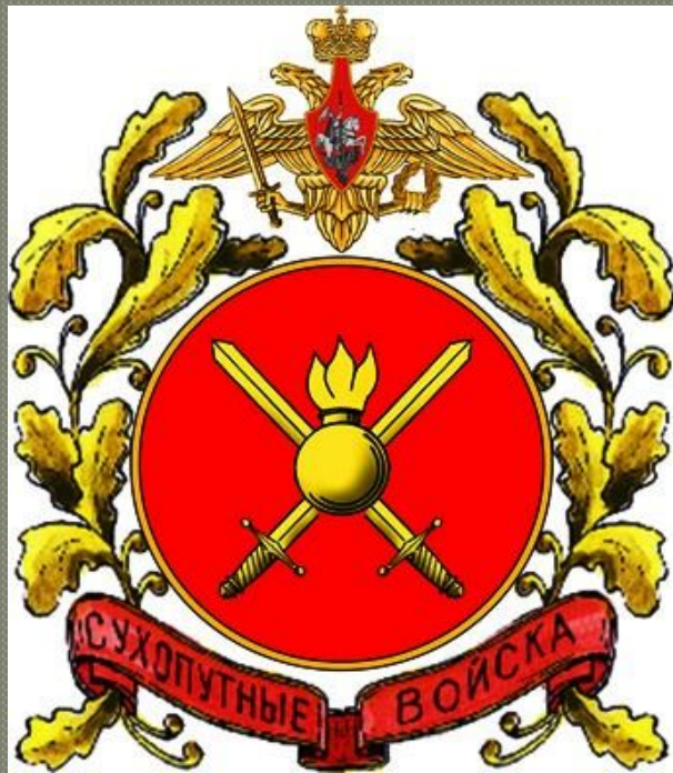
Большая эмблема СВ