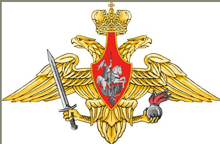
Средняя эмблема СВ