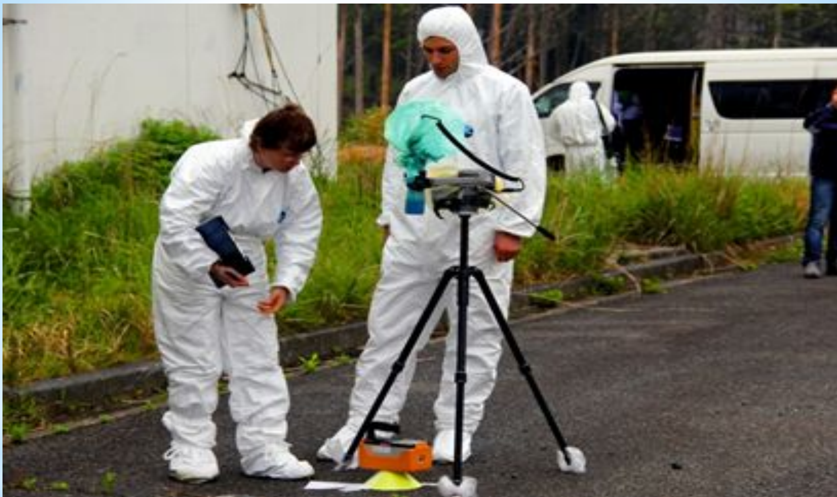
Эксперты МАГАТЭ. Фукусима, зона эвакуации, 29 марта 2011 г ●