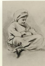
Афанасий Иванович Бунин, отец писателя