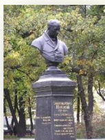
Памятник Жуковскому в Александровском саду в Санкт-Петербурге