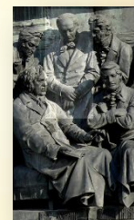
В. А. Жуковский на Памятнике «1000-летие России» в Великом Новгороде

Заслуга Жуковского собственно перед искусством состояла в том, что он дал возможность содержания русской поэзии.