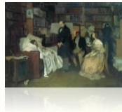
П. Ф. Борель. Прибытие раненого Пушкина. 1885.

В период ссылки Александра Сергеевича с 1824 по 1826 год он часто заступался за Пушкина перед царем и всячески пытался сглаживать острые углы их отношений. Именно Жуковскому приписывают предотвращение первой дуэли Пушкина и Дантеса. Когда же в феврале 1837 года Пушкин был смертельно ранен, Жуковскому выпало стать душеприказчиком великого русского поэта. Позже он заботился и о семье безвременно погибшего Пушкина, и о его рукописях. Деятельность эта нанесла большой урон отношениям Жуковского с царским двором и с самой императорской фамилией.