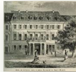
Баден-Баден. Дом, в котором жил в последние годы и умер В.А. Жуковский

Гуманистическим идеалам Жуковский остался верен до конца дней. В его представлениях значительность и подлинная ценность человека состоят в высокой духовности, в благородных чувствах и помыслах. Жуковский с большим пафосом прославляет человека.