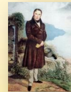
В.А. Жуковский. Акварель Г. Рейнтерна. 1834 г.