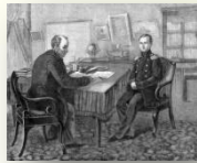
Цесаревич Александр Николаевич с В.А. Жуковским. 1838 г.