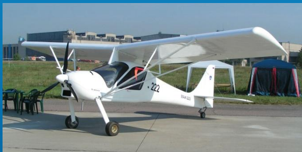
самолёт МАИ-223 на МАКС-2015

МАИ — технопарк, в котором сконцентрированы научно-исследовательские центры, лаборатории, ресурсные центры, конструкторские бюро, опытно-экспериментальный завод, объекты социального комплекса, базы отдыха, аэродром.