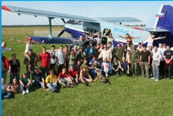
аэродром МАИ «Алферьево»