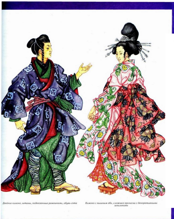
平安时代服饰图解之“衣冠装束”