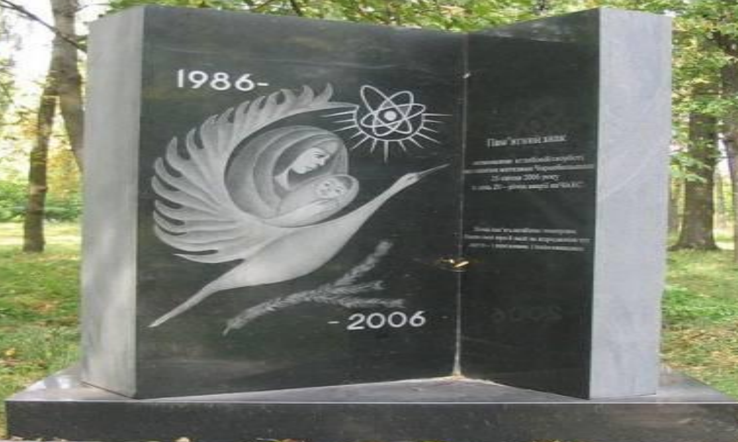
Памятный знак, установленный к двадцатилетию аварии на ЧАЭС. Парк в Чернобыле