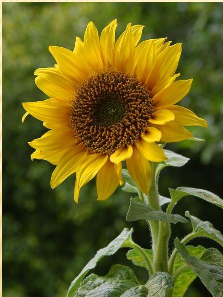
ПОДСОЛНЕЧНИК «Солнечный цветок»