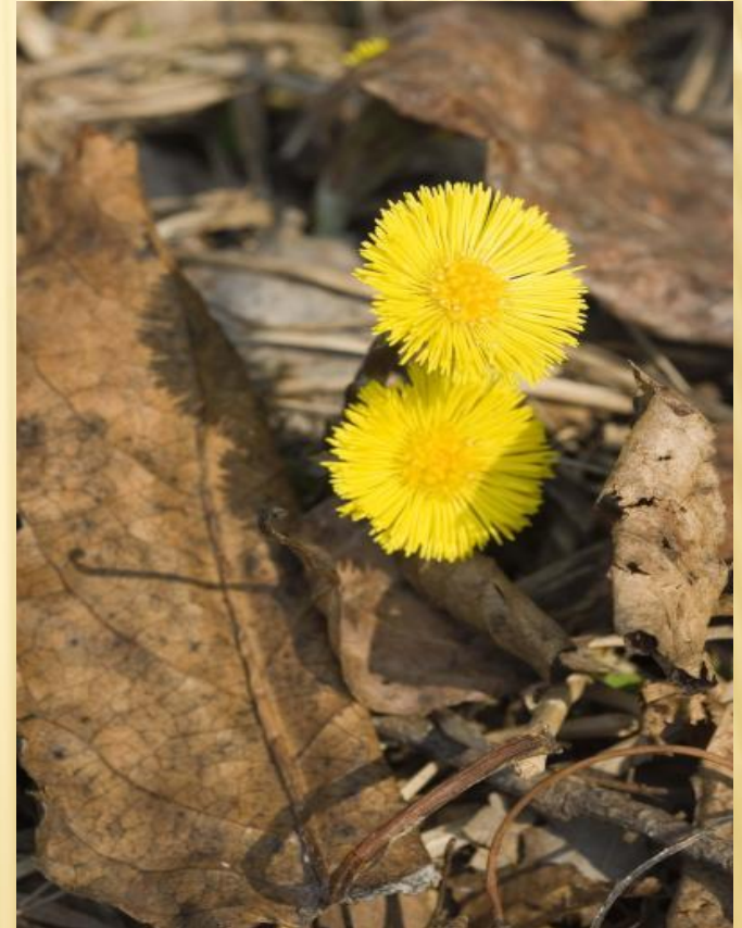
Мать- и- мачеха