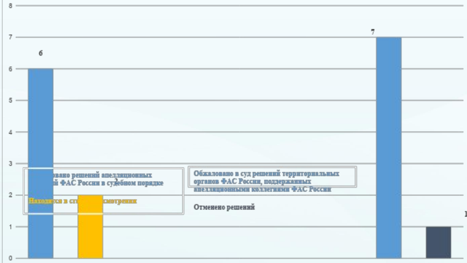
Обжалование решений апелляционных коллегий ФАС России и Территориальных органов ФАС России в судах