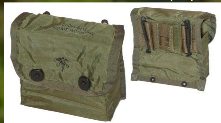
Любые натовские укладки