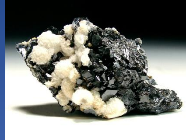
Цинковая обманка (сфалерит) - сульфид цинка ZnS

Вымывание в термальных водах вместе с свинцом