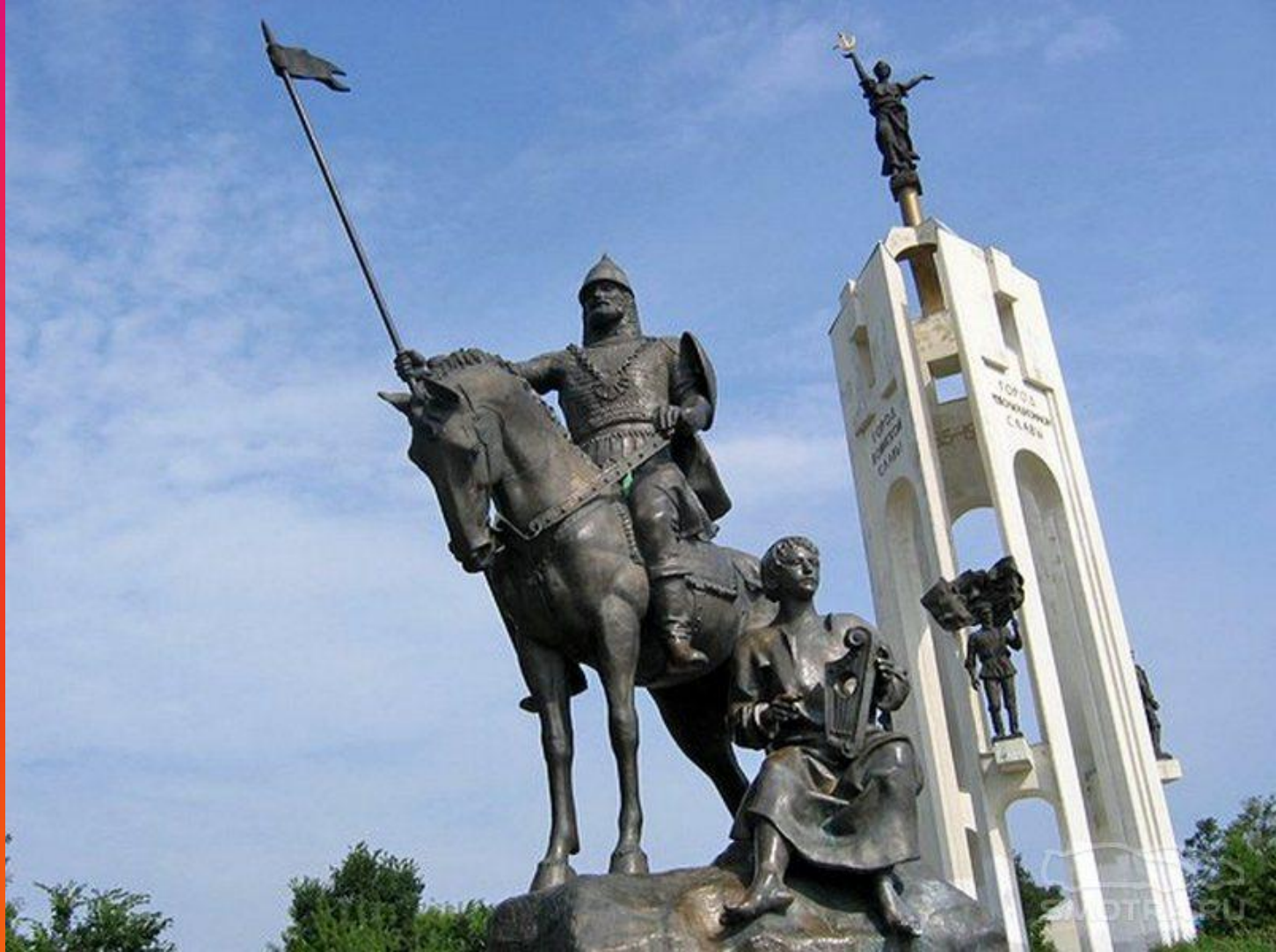
Памятник Пересвету и Бояну на Покровской горе в Советском районе