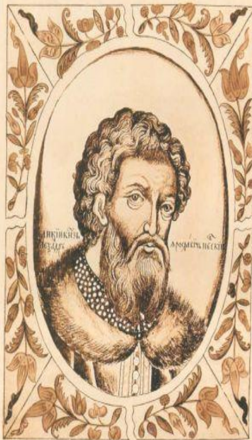
Александр Ярославич Невский (1221–1263 гг.)